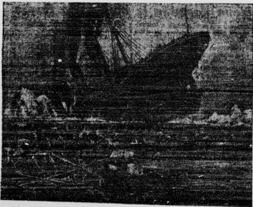
Fred 25 leti se je dogodila na morju med Evropo in Ameriko strahovita nesreča. Nova ladja »Titanic« je zadela na ledeno goro in se potopila. Od potnikov so rešili le 661 ljudi, 1563 pa jih je utonilo. Slika kaže, kako se ladja potaplja.