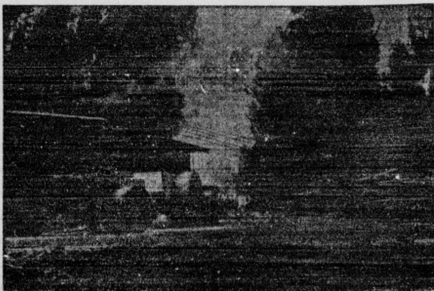
Italijani skušajo rodovitne predele osvojene Absesinije čim prej pripraviti do tega, da bi donosali dobiček. Posebno moderne ceste grade z vso vnašo. Tak prizor nam kaže naša slika.

s V Indiji vre. Vesti iz Indije povzročajo v zadnjem času v Angliji precejšnjo skrb.