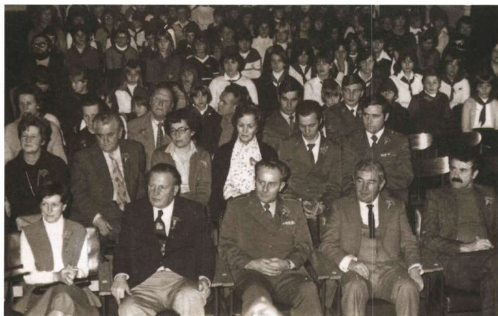
Festival Kurirček, otvoritev 1979 v Domu JLA.

Pobuda za ustanovitev revije je bila dana na posvetovanju o mladinski književnosti s tematiko NOB, ki je potekalo v okviru prvega festivala Kurirček v Mariboru decembra 1963.