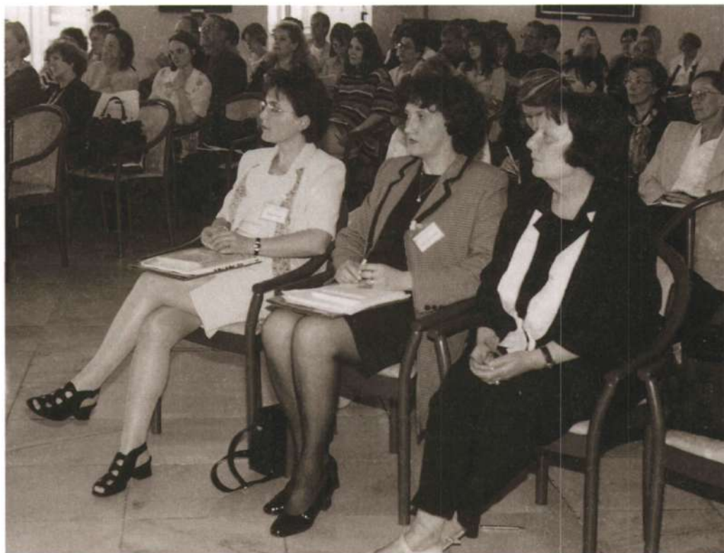
Simpozij Perspektive v mladinski književnosti ob 50 – letnici Mariborske knjižnice, 1999.