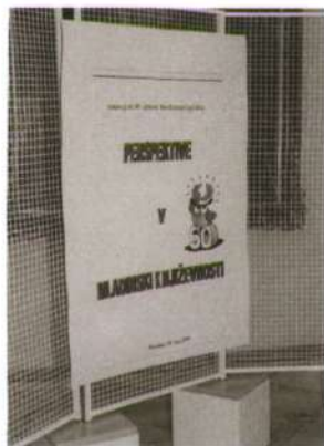
Simpozij Perspektive v mladinski književnosti, 1999.