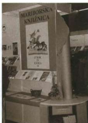
Predstavitev revije na Slovenskem knjižnem sejmu v Cankarjevem domu, 1998.

Od leta 1989 urednica revije ni bila več zaposlena v Mariborski knjižnici, kar je močno vplivalo na dinamiko dela revije. Zato je Mariborska knjižnica leta 1996 omogočila urednici revije polovično zaposlitev. Hkrati je v svojih načrtih podprla mnenje uredništva, da bi bilo za še uspešnejši in odmevnejši prodor na področju mladinske književnosti, ki se je v teh letih močno razvilo, delo urednika potrebno profesionalizirati, revijo pa izdajati štirikrat letno.