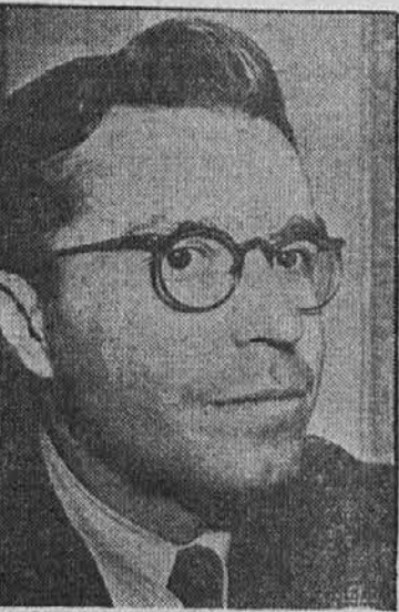
LA PAZ, BOLIVIA—Victor Estensoro, leader of the coup which the government of General Enrique Peñaranda of Bolivia was overthrown. American diplomats are watching political developments in several other South American countries.