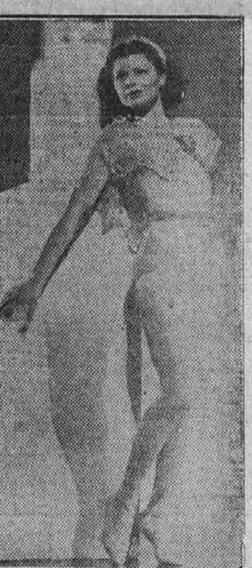
V soboto, 29. januarja se prične predvajati v mestnem avditoriju, velikanski Rodeo cirkus, ki bo trajal do 6. februarja. Vsak večer se bo predstava vršila ob 8.30 uri zvečer, ob nedeljah pa ob 2.30 in 8.30 uri.

Tu bodo nastopili številni drzni jahachi, dekleta, ki bodo proizvajala razne akrobatične točke, in umetniki, ki bodo držali javnost v napetosti od kraja do konca predstave. Vstopnice so že sedaj naprodaj v mestnem avditoriju ter v Walgreen's lekarnah.