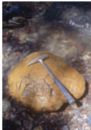
Konkrecija s premerom okoli 50 cm, največje pa dosega do 80 cm.

Notranjost konkrecij sestavlja temnosiv apnenec, na zunanji strani močno preperevajo, zato je zunanost limonitizirana in večinoma nepravilno razpokana. Prevladujejo konkrecije svetlorjave do rjave barve, ponekod pa so sivkaste ali popol-