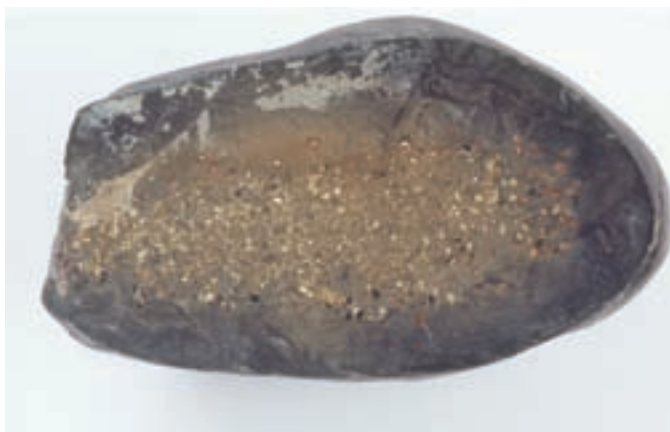
Drobni kristali pirita v razpoki konkrecije; 40 x 75 mm. Najdba in zbirka Miša Serajnika. Foto: Ciril Mlinar

noma sive. Nekatere so okrogle, druge ovalne in razpotegnjene. V nekaterih jedrih konkrecij so v glinavcu drobni kristali pirita . Majhni kristali pirita so večinoma v obliki kock in pentagonskih dodekaedrov. Na mestih, kjer glinavce prečka potok in jih v podlagi razgali, lahko najdemo posamezne sive krogle s premerom 10 do 20 cm, ki so že izluščene ali se iz kamnine z lahko izluščijo. Največje konkrecije dosežejo do 80 cm v premeru, njihova masa pa je do 100 kg. Največjih voda večinoma ne odnaša, zato ležijo vseprek po hudourniških pritokih, kjer jih voda znova in znova obrača in vrti in s tem brusi v prav zanimive oblike. Kljub temu, da večinoma v njihovi notranjosti ni kristaliziranih ali makroskopskih mineralov, so zelo zanimive.