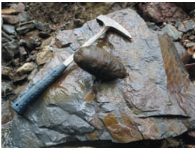
Konkrecije v sovodenskih grapah imajo najrazličnejše valjaste oblike.

noma sive. Nekatere so okrogle, druge ovalne in razpotegnjene. V nekaterih jedrih konkrecij so v glinavcu drobni kristali pirita . Majhni kristali pirita so večinoma v obliki kock in pentagonskih dodekaedrov. Na mestih, kjer glinavce prečka potok in jih v podlagi razgali, lahko najdemo posamezne sive krogle s premerom 10 do 20 cm, ki so že izluščene ali se iz kamnine z lahko izluščijo. Največje konkrecije dosežejo do 80 cm v premeru, njihova masa pa je do 100 kg. Največjih voda večinoma ne odnaša, zato ležijo vseprek po hudourniških pritokih, kjer jih voda znova in znova obrača in vrti in s tem brusi v prav zanimive oblike. Kljub temu, da večinoma v njihovi notranjosti ni kristaliziranih ali makroskopskih mineralov, so zelo zanimive.