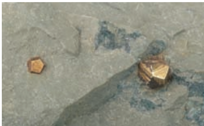
Drobne, do 5 mm velike kristale pirita z razvitimi ploskvami pentagonskega dodekaedra najdemo v neposredni bližini konkrecij. Najdba in zbirka Vilija Rakovca.

V neposredni bližini nahajališča konkrecij je ponekod v sivih in sivozelenkastih peščenjakih in konglomeratih grödenske formacije manjša uranova mineralizacija, pomembnejša pa je bakrova, ki je v višjih plasteh. Prav na območju najlepših konkrecij lahko vidimo star opuščen rov, kjer so v preteklosti kopali bakrovo rudo; Italijani med drugo svetovno vojno, raziskave pa so potekale tudi po vojni. Ozemlje ima luskasto zgradbo, orudjenje pa je v plasteh iz permokarbonskih meljevcev, ki se izmenjujejo z glinavci ter grödenskim peščenjakom ter zgor-njepermskim apnencem in dolomitom. Apnenec in dolomit sta v stiku s psevdodziljskimi črnimi skrilavci z vložki apnencev in tufov. Bakrova mineralizacija je v sivih peščenjakih in meljevcih. Orudene plasti so oddaljene 20 do 30 m od stika z zgornjepermskim apnencem in dolomitom. Orudjenje, široko 2,5 m, je v srednjeznatem sivem masivnem kremenovem peščenjaku, širokem od 10 do 30 m. Najpogostejša rudna minerala sta bornit in halkopirit , opazimo pa lahko številne drobne kristale pirita ter žile kalcita in kremenca. Vsebnost bakra niha med 0,35 do 6,15 mas. %, povprečna pa je 0,97 mas. %.