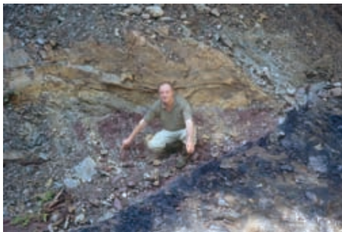
Tektonski prehodi med različnimi grödenskimi plastmi.