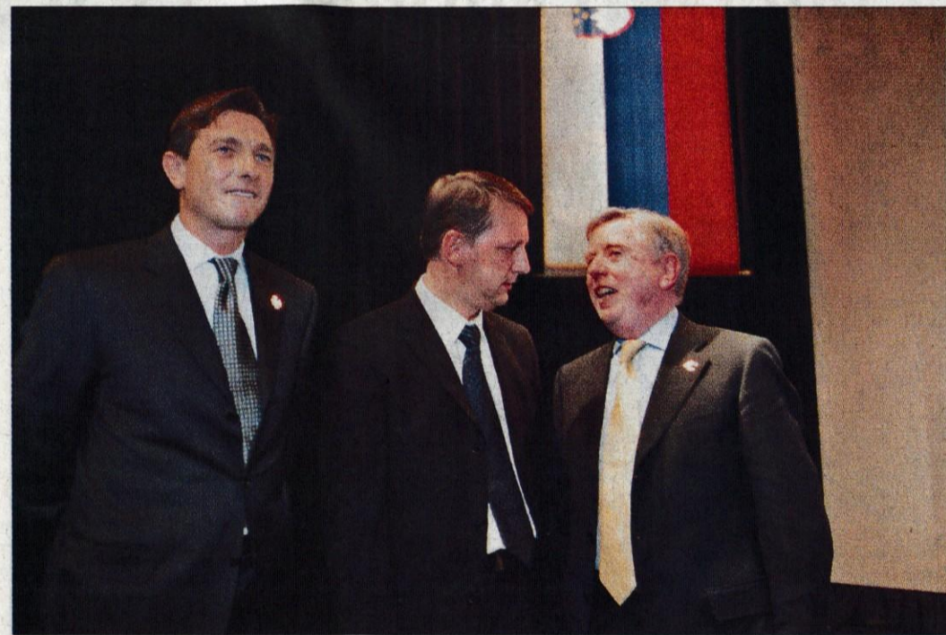
Zadovoljni z izidom referenduma. Od leve Borut Pahor, Anton Rop in Patrick Cox.

članice unije ne bo zapletov. Slovenijo je v nedeljo, na dan referenduma, obiskal predsednik Evropskega parlamenta Patrick Cox. Navdušen nad izidom referenduma je tako v Centru Evropa kot zvečer v tiskovnem središču v Cankarjevem domu ponavljal, da je Slovenija sedaj tudi uradno doma v Evropi. Predsednik državnega zbora Borut Pahor pa je povedal, da so bili Slovenci razumni in pogumni, ker so kljub zapletenim mednarodnim razmeram glasovali za članstvo v obeh organizacijah. Državni zbor bo končal z usklajevanjem naše zakonodaje z zakonodajo Evropske unije. Kljub prenosu nekaterih pristojnosti na organe Evropske skupnosti bo državni zbor še naprej odločal o bistvenih stvareh. Prihodnje leto bomo v Sloveniji izvolili prvih sedem poslancev v Evropski parlament.