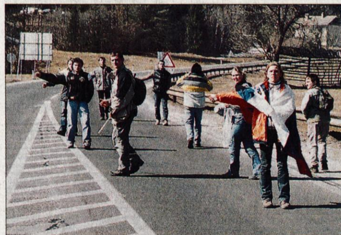
Marsikdo se je odpravil proti Planici kar peš.