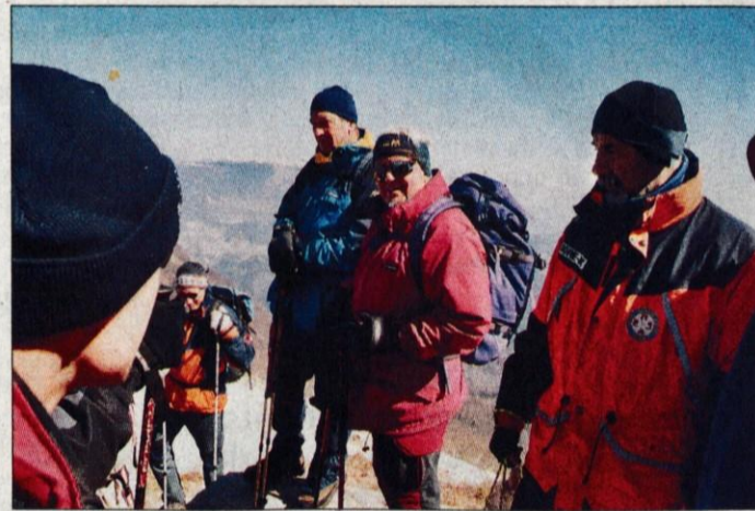
Med pohodniki je bil tudi bivši predsednik Milan Kučan.

Pridružili sva se gruči pohodnikov in veselo "vzeli" pot pod noge. Pohoda se je udeležilo veliko ljudi, vendar ni bilo gneče, ker so se ljudje po poti porazgubili. Eni so šli hitreje, drugi počasneje. Spodnji del poti je bil spolzek. Sonce še ni stopilo snega, temperature so bile nizke in pod snegom je bil led. Pot se je kasneje razdelila na daljšo in krajšo: skozi gozd ali po strmem travniku skozi gozdiček, kar pa niti ni bilo tako enostavno. Najina zgodba se začne že pri prvem križišču.