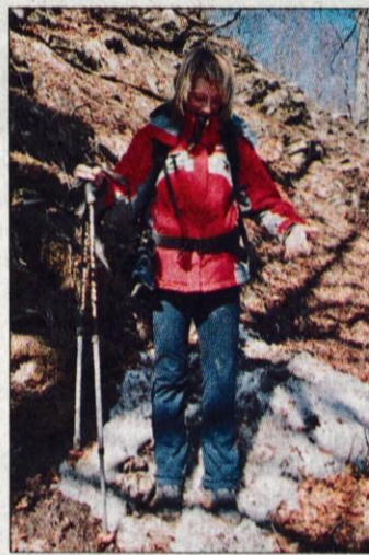
No, če ti spodrsne si pa ves blaten.