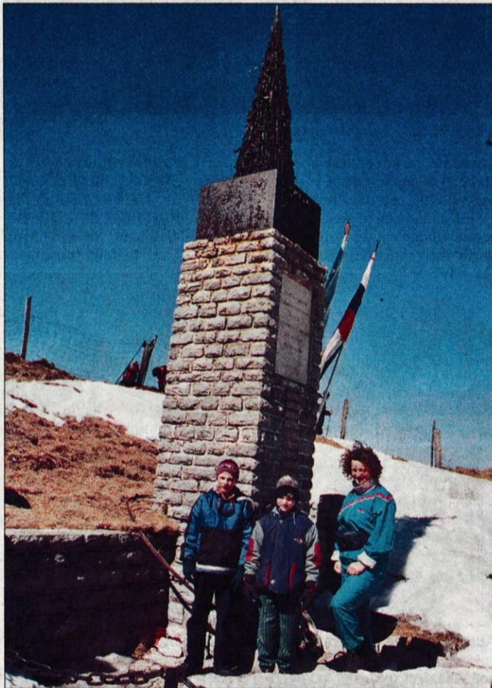
Pohodniki so za trenutek obstali pri spomeniku padlim na Poreznu.

pohodnikov. Verjetno bi bila številka večja, če ne bi na iste dni v Planici potekali smučarski skoki.