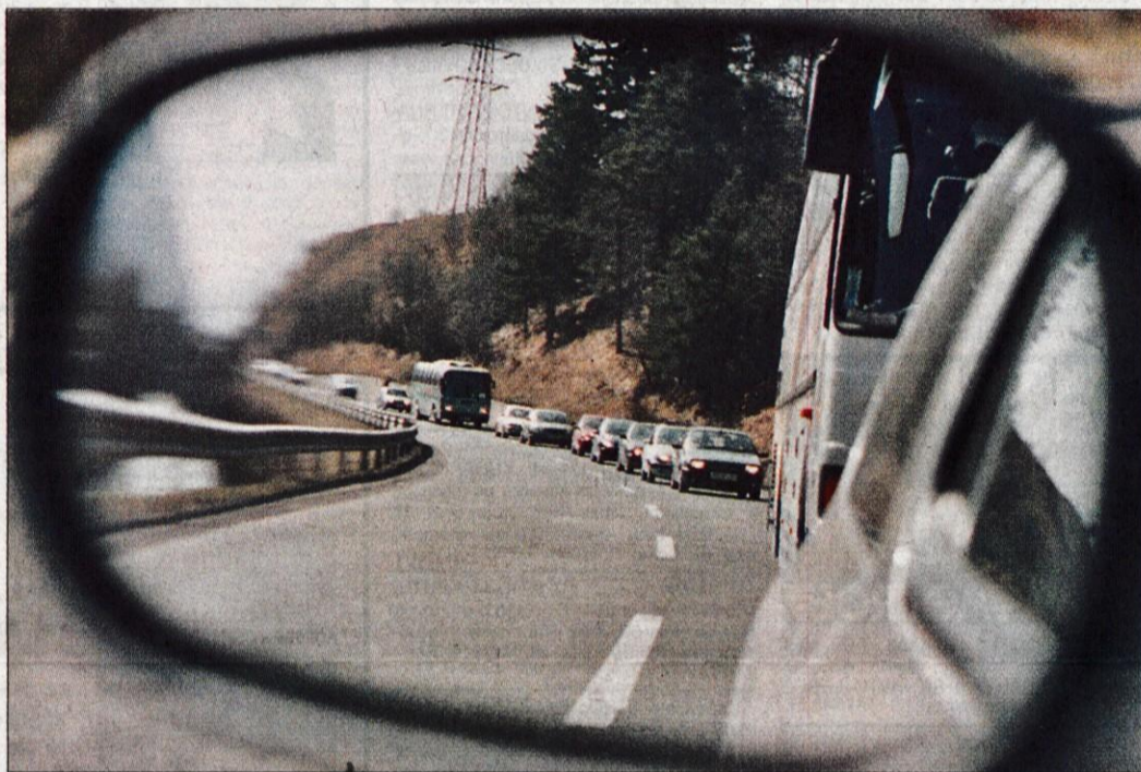
V soboto se je proti Planici vila kolona vozil.

prireditve izpred hotela Kompas v Kranjski Gori do Planice in nazaj, je bila stvar počasna zaradi količine avtobusov in številnih osebnih avtomobilov, ki so želeli čim bližje Planici. V Planici smo srečali precej zanimivih ljudi, ki so se odločili za ogled tradicionalne športne prireditve. Športniki, njihovi trenerji, ožje sorodstvo, znanе slovenske osebnosti in številni tujci so predstavljali del množice, ki je navijala za svojega zmagovalca planiških poletov. Med šte-