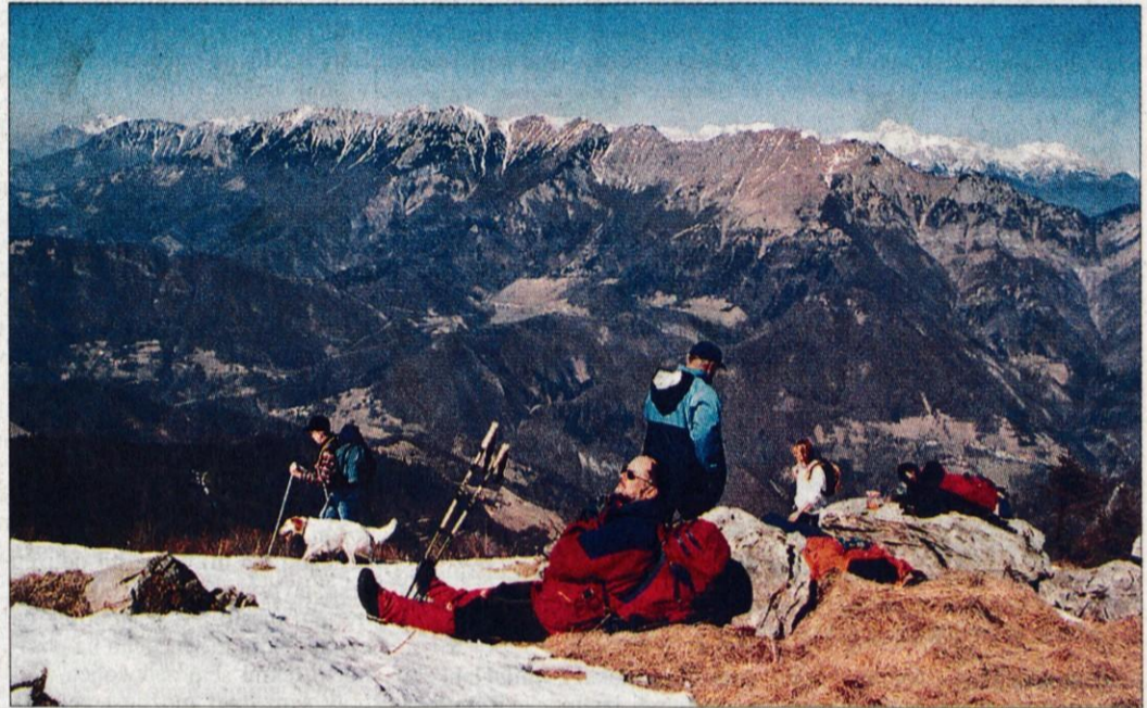
Po naporni hoji je marsikdo na vrhu kar obsedel.

Da o vlagi, razpravljanju o spajku medvedov in "poglej, tole pa divje svinje naredijo", ne govo-