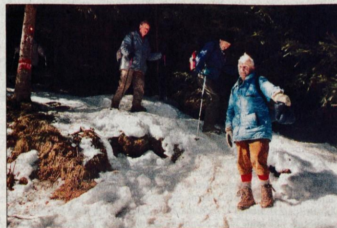
Stane (desno) se je tudi lansko leto udeležil pohoda na Porezen.

Tekmuje se na lastno odgovornost. Prijavite se lahko po internetu ( http://www.kalisce.com ), v domu na Kališču, v fitness centru Power fit v Prebačevem, v avto centru Boltez v Kranju ali na telefonski številki 04/ 232 63 46 in 041 691 249, ter izjemoma na dan preizkusa do 6. ure zjutraj. A.B.