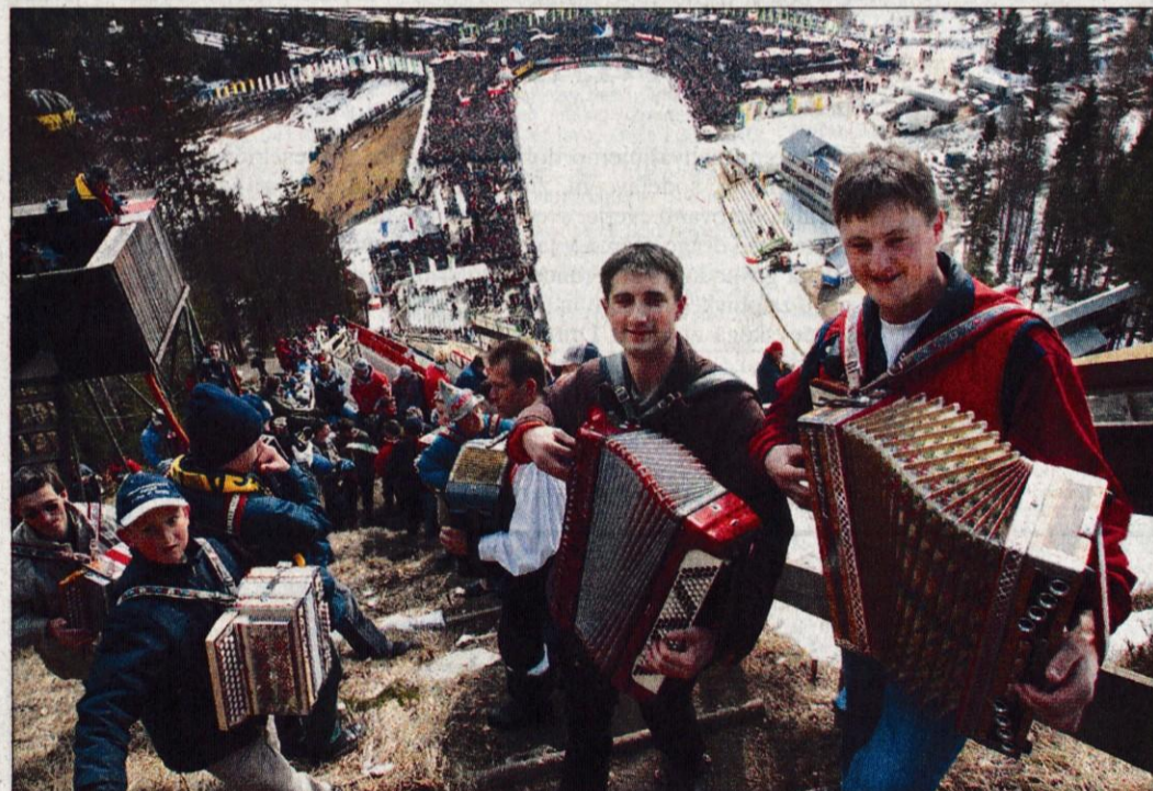
Nastop nad 1000 harmonikarjev pred sobotno tekmo je bila ena od atrakcij letošnje Planice.

Alenka Brun, foto: Tina Dokl, Gorazd Kavčič