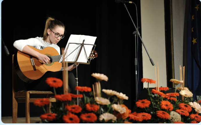
KULTURNO DVORANO SMO OB TEM DOGODKU PREIMENOVALI V KULTURNO DVORANO JANEZA FERENCA.