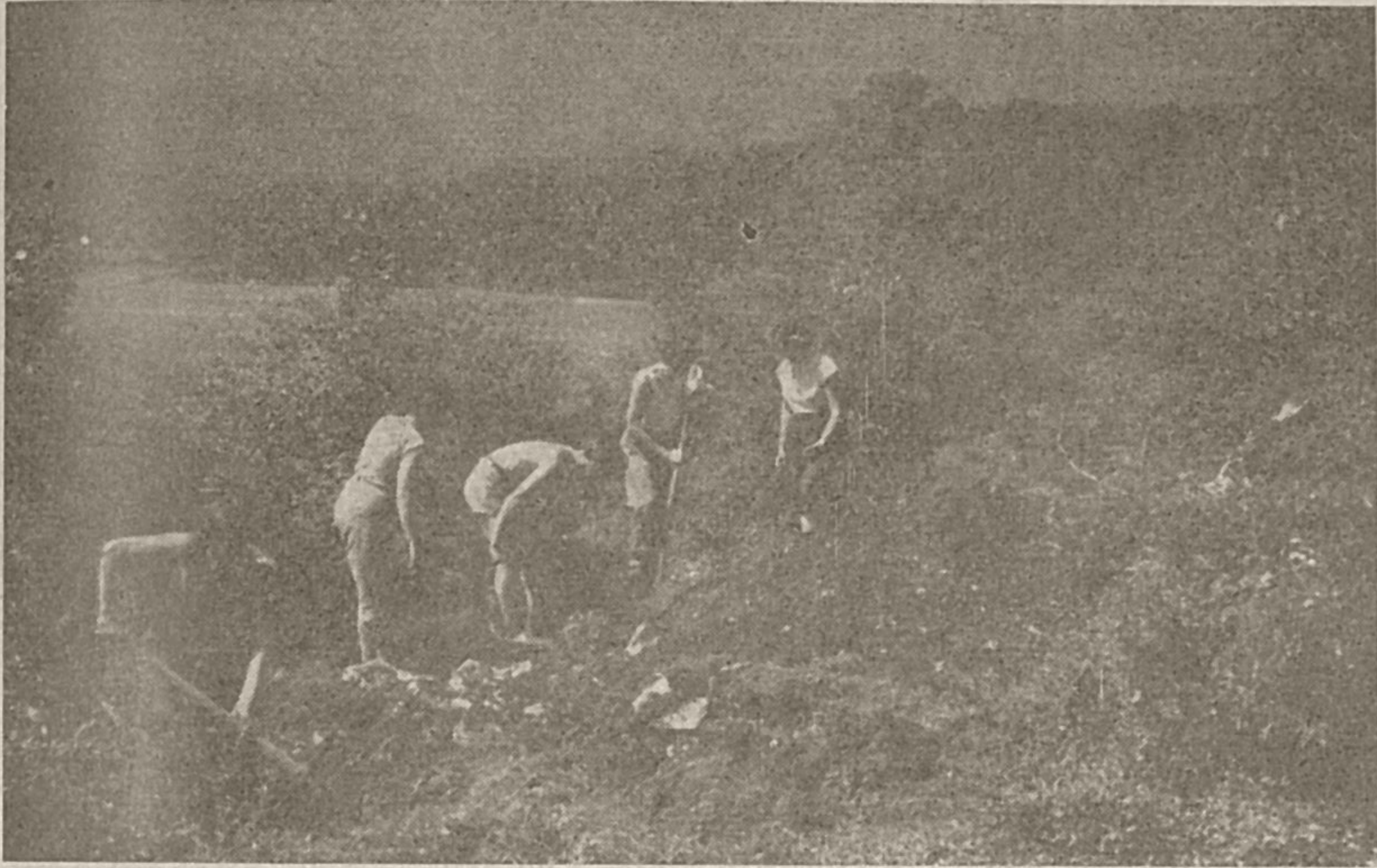
Arheološka izkopavanja na Tržišču v Dolenji vasi

nega razgleda na Cerkniško jezero, Loško dolino in Snežnik, ampak tudi zaradi Križne jame z nizom jezerc in z veliko Kristalno goro, ki po svoje lepoti lahko tekmuje z Veliko goro Postojnske jame. Južnovzhodno od Križne gore se razprostira slikovita Loška dolina z Velikim in Malim Obrhom. Lož je dobil prvi na Notranjskem pravice mesta že v 15. stoletju. Nad njim so razvaline nekdanjega tako mogočnega gradu, ki je gospodoval mestu. Na južnem koncu Loške doline pa je dobro ohranjeni Snežniški grad.