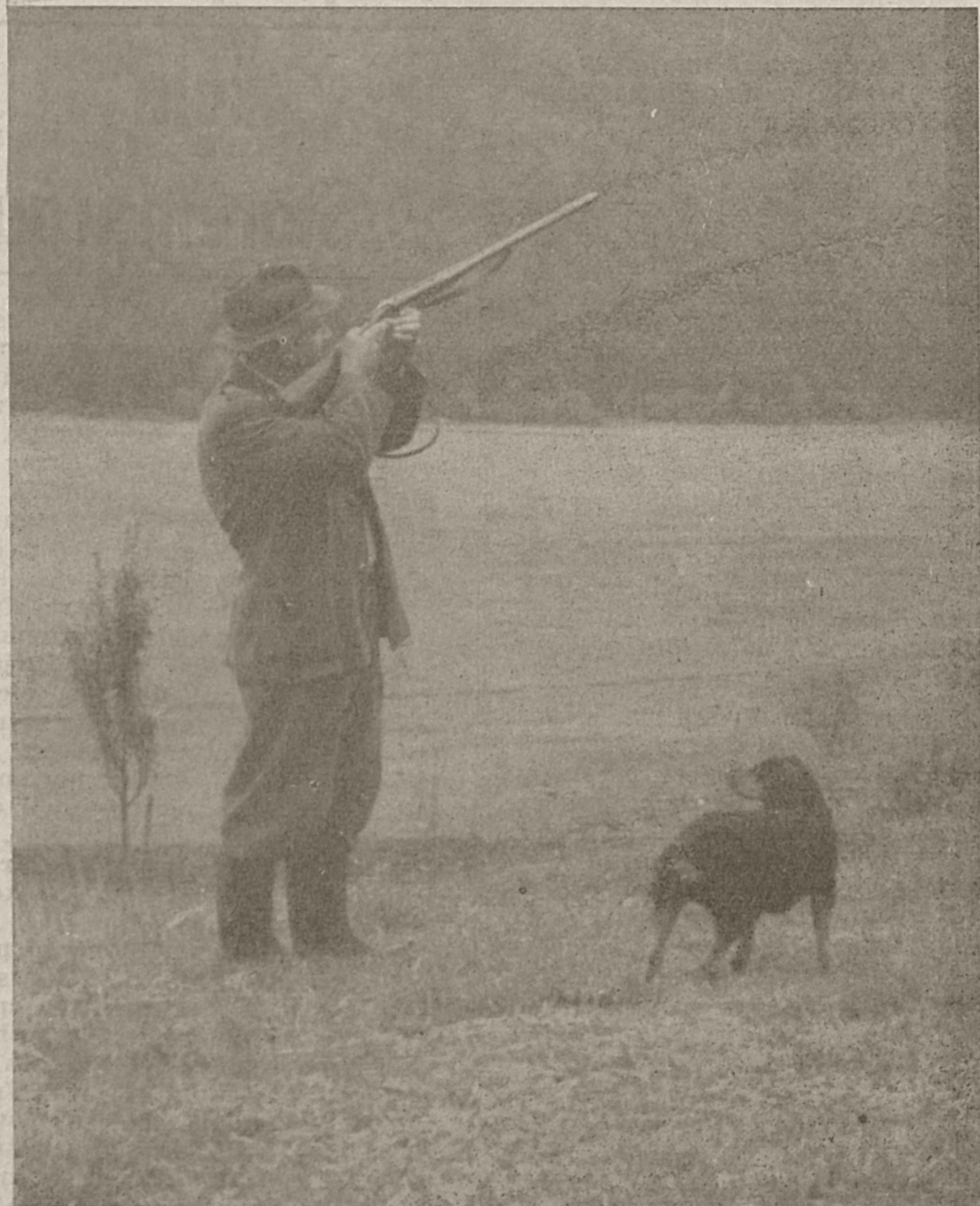
Strel v višino, raca manj v jati. Pes Elan čaka na gospodarjev ukaz, da prinese ostrostrelcu letečo trofejo