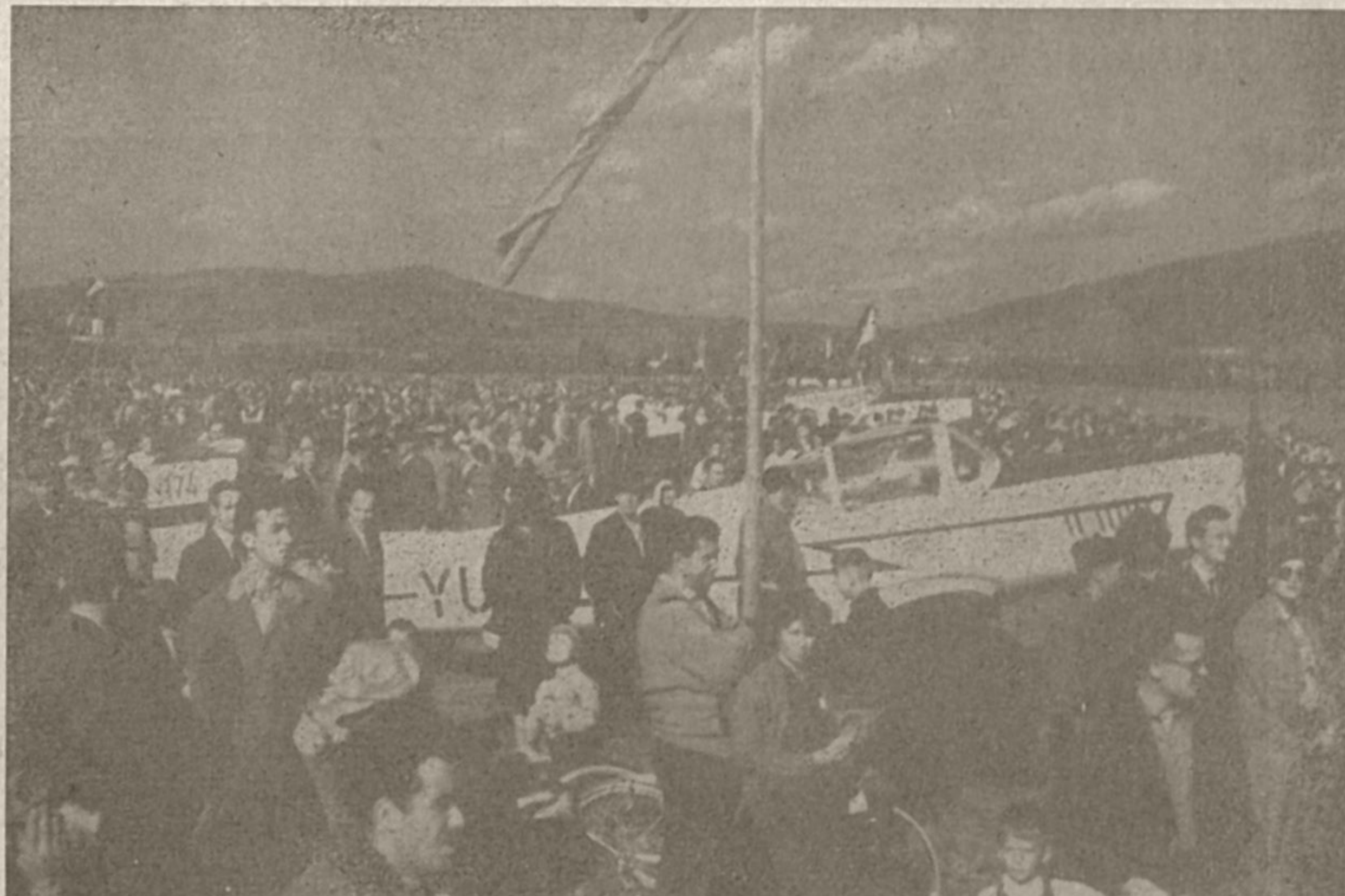
Tisoči so pripotovali iz krajev širom Slovenije, da bi si ogledali prvi letalski miting na Cerkniškem jezeru

Prireditve se je ob mnogih zapletljajih vlekla h koncu. Videli smo vojaška šolska letala, jadralna letala in dva padalca, od katerih je eden skočil z zadržkom. Še kaj? Brskam po spominu, pa se resnično ne spomnim ničesar več. Prišlo je le pet aeroklubov, ker letala drugih zaradi premočnega vetra niso mogla vzleteti. Če delajo aeroklubi, ki so prišli, to kar smo videli, potem je njihova dejavnost sila skromna.