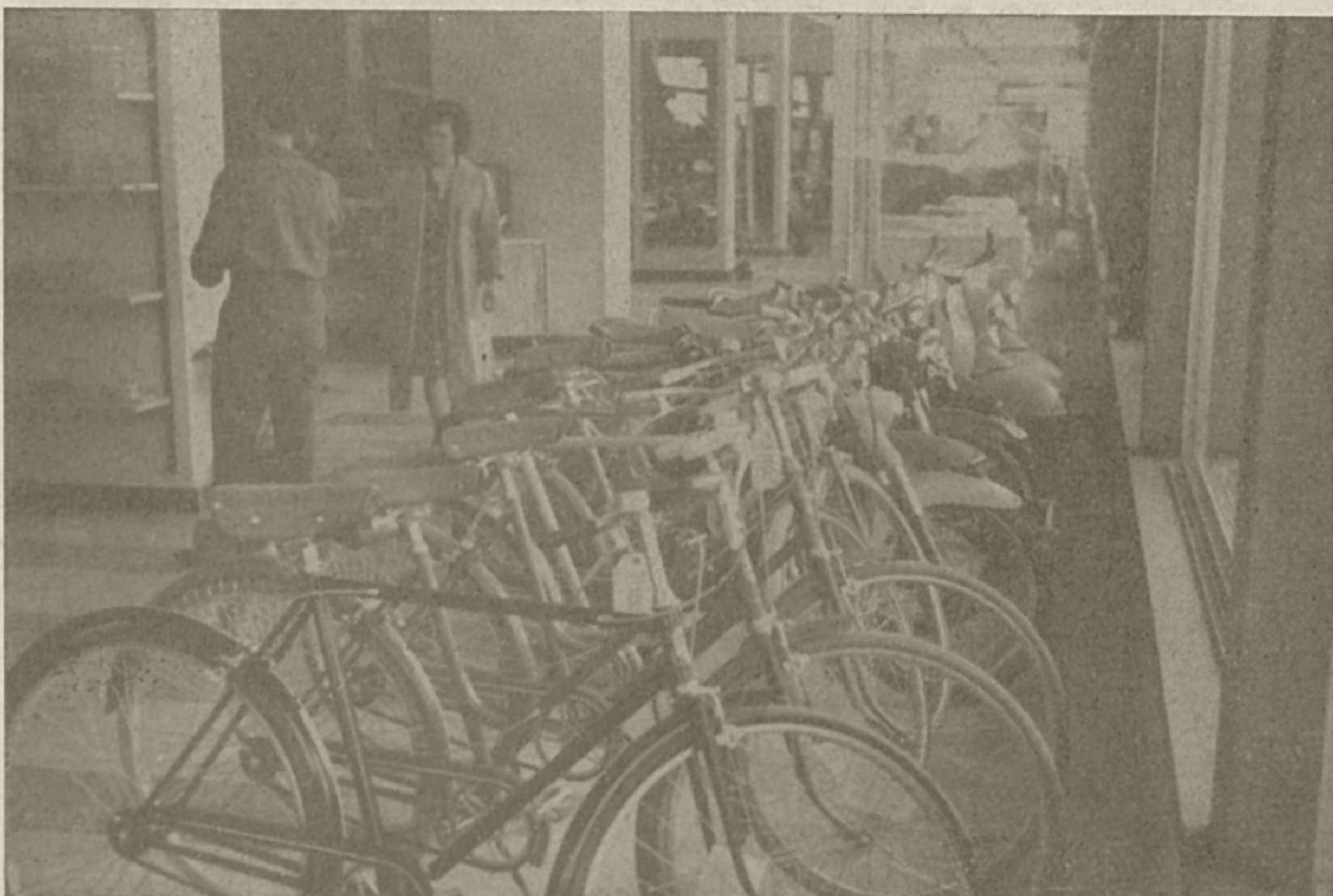
Dobra izbira — predpogoj za uspešno poslovanje in zadovoljstvo potrošnikov