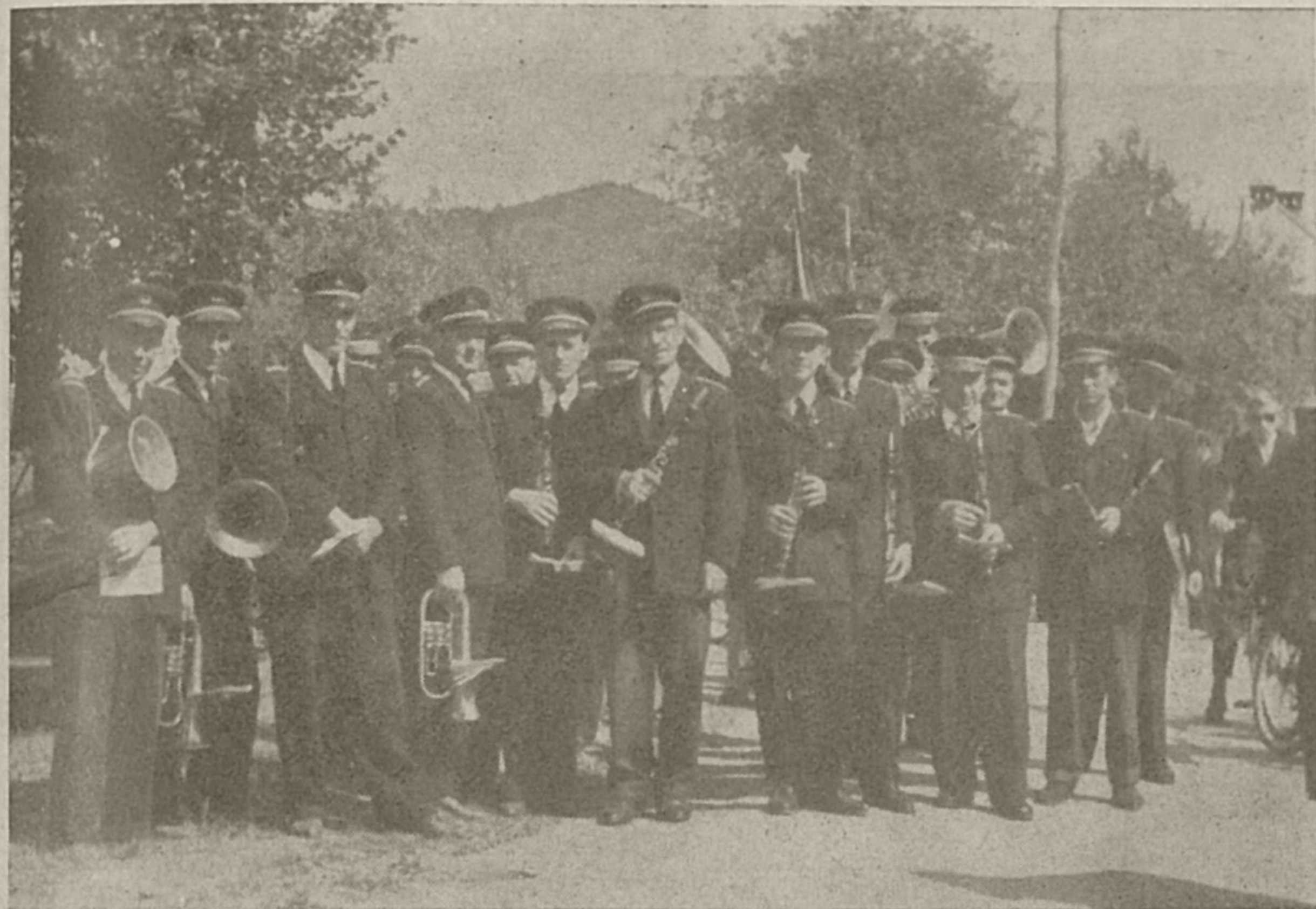
Cerkniška godba na obisku v Ložu

Bili so ves čas edini, ki so orali ledino v glasbenem svetu pri nas. Pravzaprav imajo malo ljudi, ki bi bili tako predani glasbi, kot so člani godbe na pihala. Mnogo samoodpovedovanja je zahtevala pot do prvega mesta, ki so ga