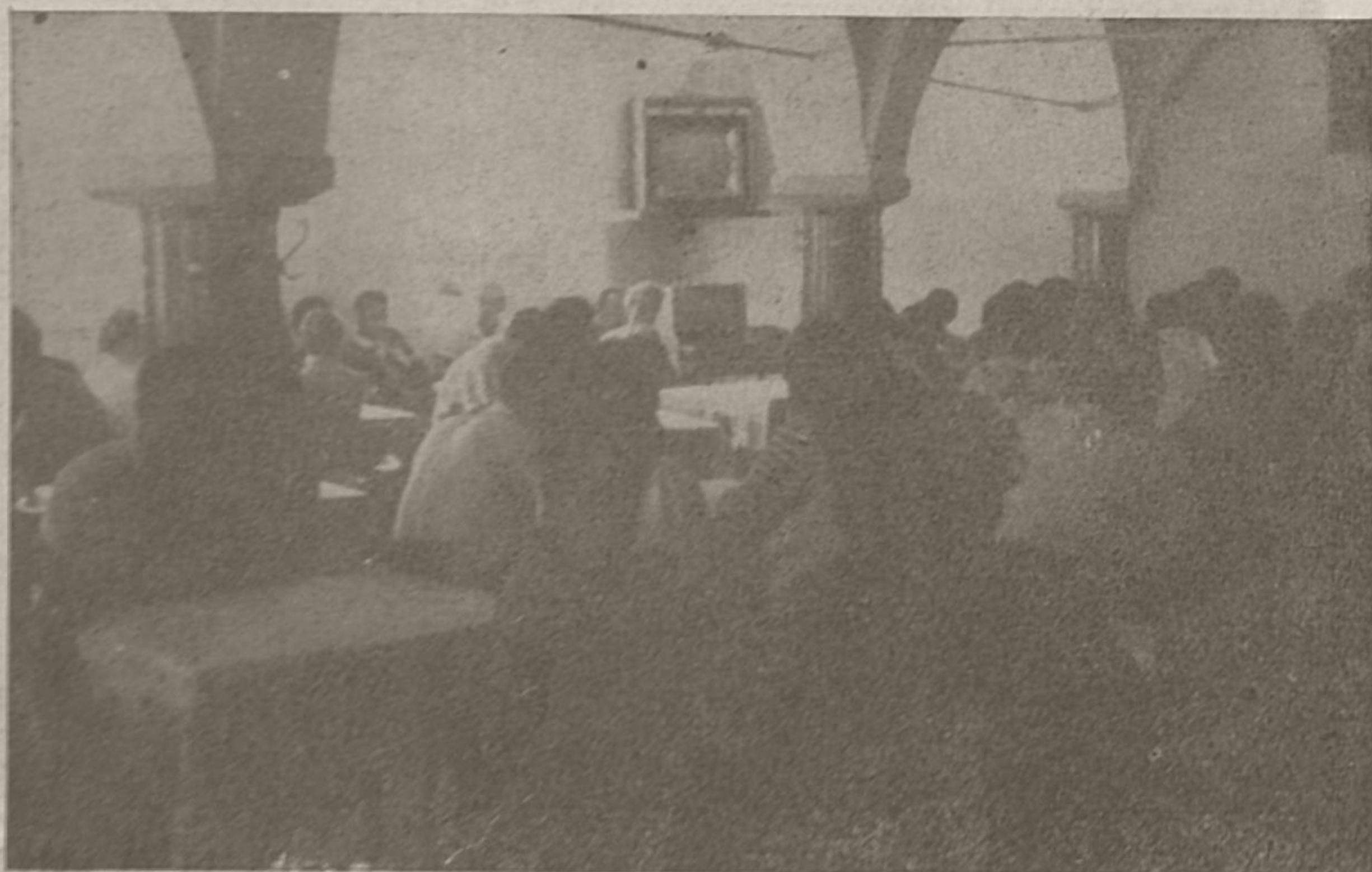
Posvetovanje mladine podjetja Brest v Martinjaku