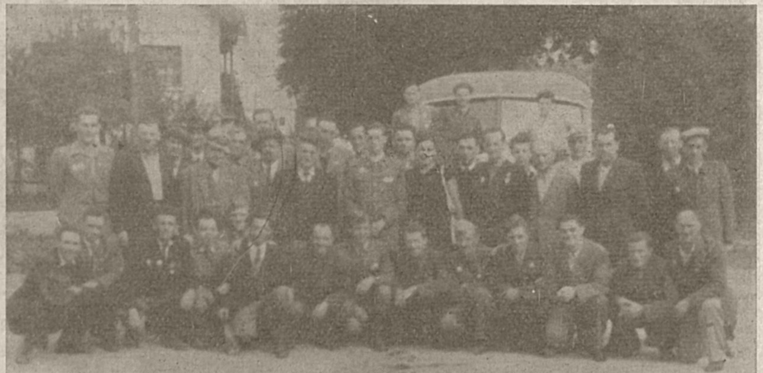
Bivši borci XIV. divizije iz cerkniške občine leta 1954 na Ostrožnem pri Celju

»Pohod XIV. divizije je znan v zgodovini NOB kot eden največjih in najtežjih v Sloveniji. Trajal je mesec dni. V času nenehnih premikov, nečloveških naporov in samopremagovanja, je bilo v diviziji, ki je združevala Tomšičevo, Šercerjevo in Bračičevo brigado z okrog 1.200 borci, 120 tovarišev s področja, ki ga obsega današnja občina Cerknica. Okrog 60 izmed njih je vojna kruto iztrgala svojcem in napisala njihova imena na