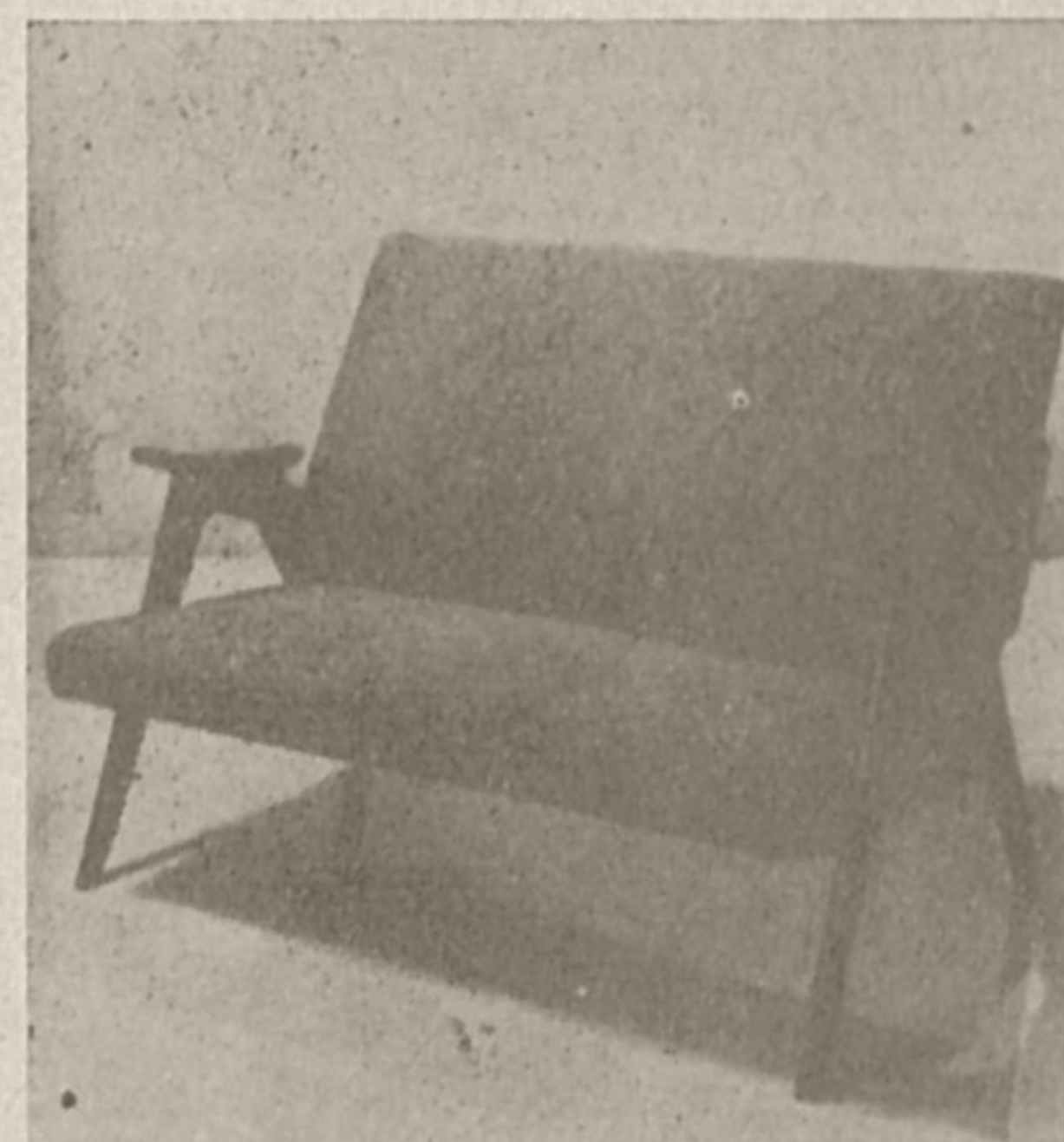
Eden od izdelkov tovarne »Brest«

Pogostokrat v praksi prisluhnemo vsakemu nepravilnemu teku stroja, nepravilnemu šumu ali ropotu v obdelovalnem stroju in takoj ukrenemo vse potrebno, da