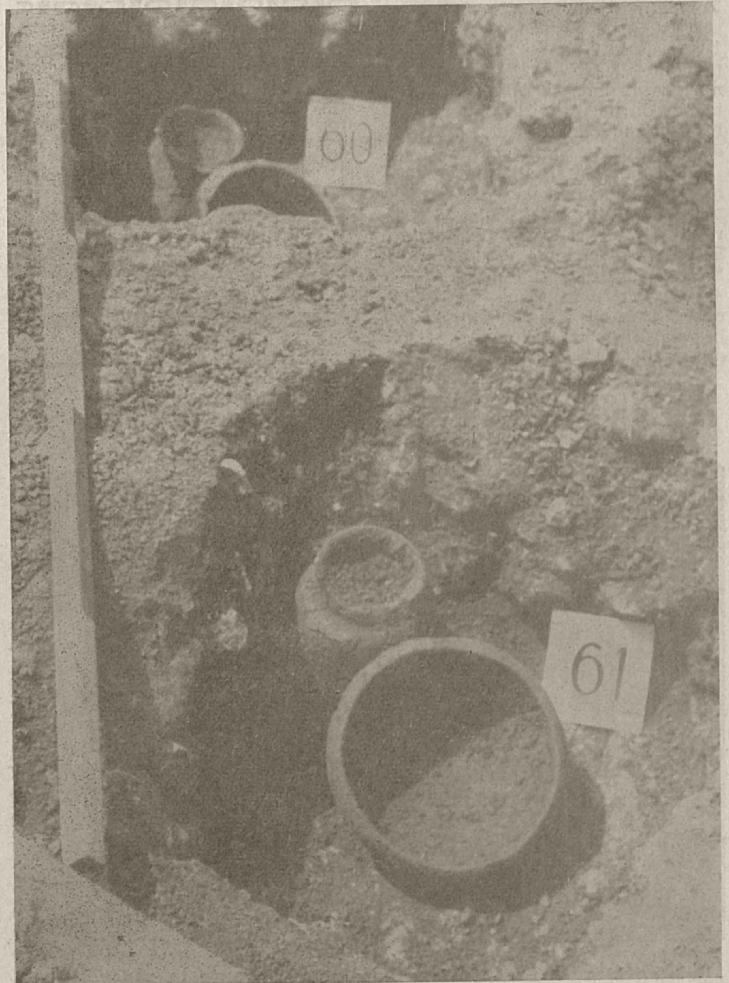
Žarna grobova pod Križno goro

Vas na Tržišču pa ni bila osamljena. Ob stari cesti na Javornike je bilo tik nad jezerom gradišče na hribčku Cvinger. Gradišče je bilo po obsegu nekoliko manjše, vendar je bilo močno utrjeno, o čemer pričajo koli. Po lončenih posodah, ki smo jih odkopali v zadnjih letih, lahko trdimo, da je bilo zgrajeno in naseljeno približ-