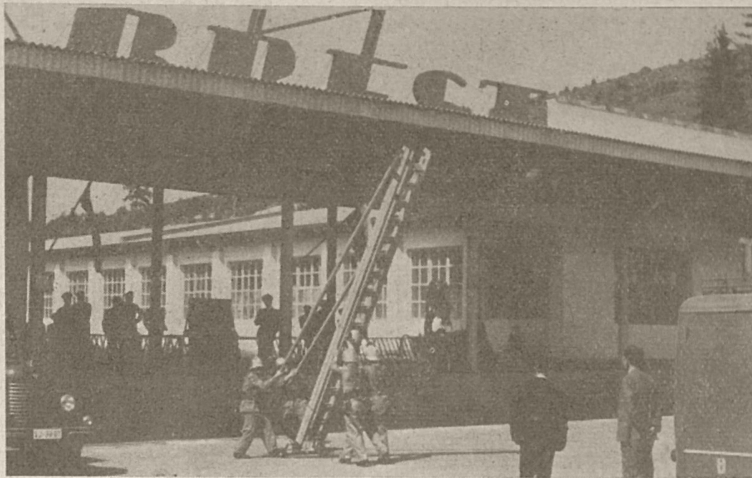
Gasilci pri praktični vaji

ja gasivska društva. Tovarna pohišstva Cerknica ima dve desetini, eno od teh sestavljajo večinoma mladi fantje, drugo pa starejši. V preteklem letu je bila organizirana tudi ženska desetina, ki je imela redne vaje, vendar je v zimskem času njihovo delo za-