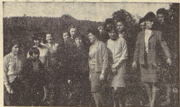
Z izleta članov kolektiva obrata urnih mehanizmov v Lipnici, ki so si tokrat ogledali Sentjerne in Preserje