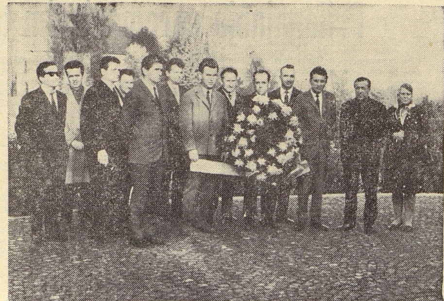
Povsod v Sloveniji so za dan mrtvih počastili spomin padlih v narodno-osvobodilni vojni. Ta posnetek kaže delegacijo Zveze borcev in članov delovnega kolektiva tovarne električnih aparatov, ki je položila venec k spomeniku žrtvam, padlih na Sv. Urhu. Tu so si ogledali nekdanjo mučilnico in lepo urejen muzej, ki pričata o grozodejstvih nad napredno usmerjenimi žrtvami belogardističnih krvoločnežev.

Avtorji študije so niso držali samo na ocenah, ampak so dali tudi več predlogov za racionaliziranje samoupravljanja s predlogom, da se tako samoupravljanje kot vodenje v delovnih organizacijah napravita učinkovitejša. Avtorji študije so soglasni v oceni, da je funkcija direktorja nevalgična točka našega samoupravnega sistema. Direktor je prenehal biti to kar je bil, toda ni postal to, kar bi moral biti. Ta vo-