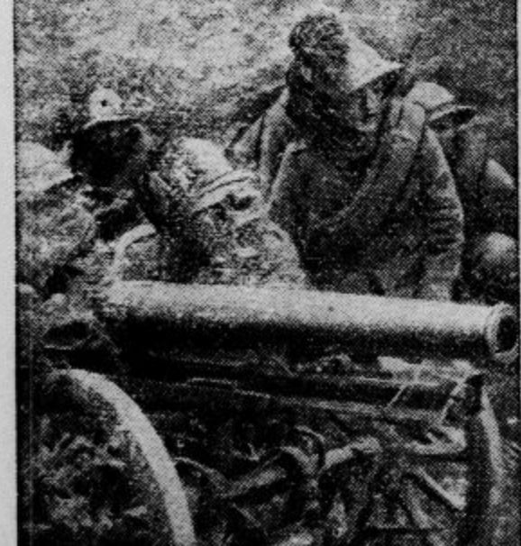
Italijanski top podpira bersaljerne pri prodiranju v sovražne dežele