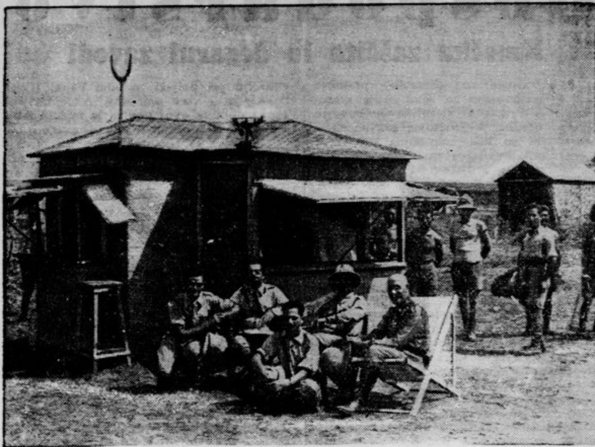
V afriškem pustem ozemlju, kjer se da le korakoma napredovati, so otvorili italijanski vojaški oddelki improvizirano kavarno, v kateri si krajšajo čas med počitkom