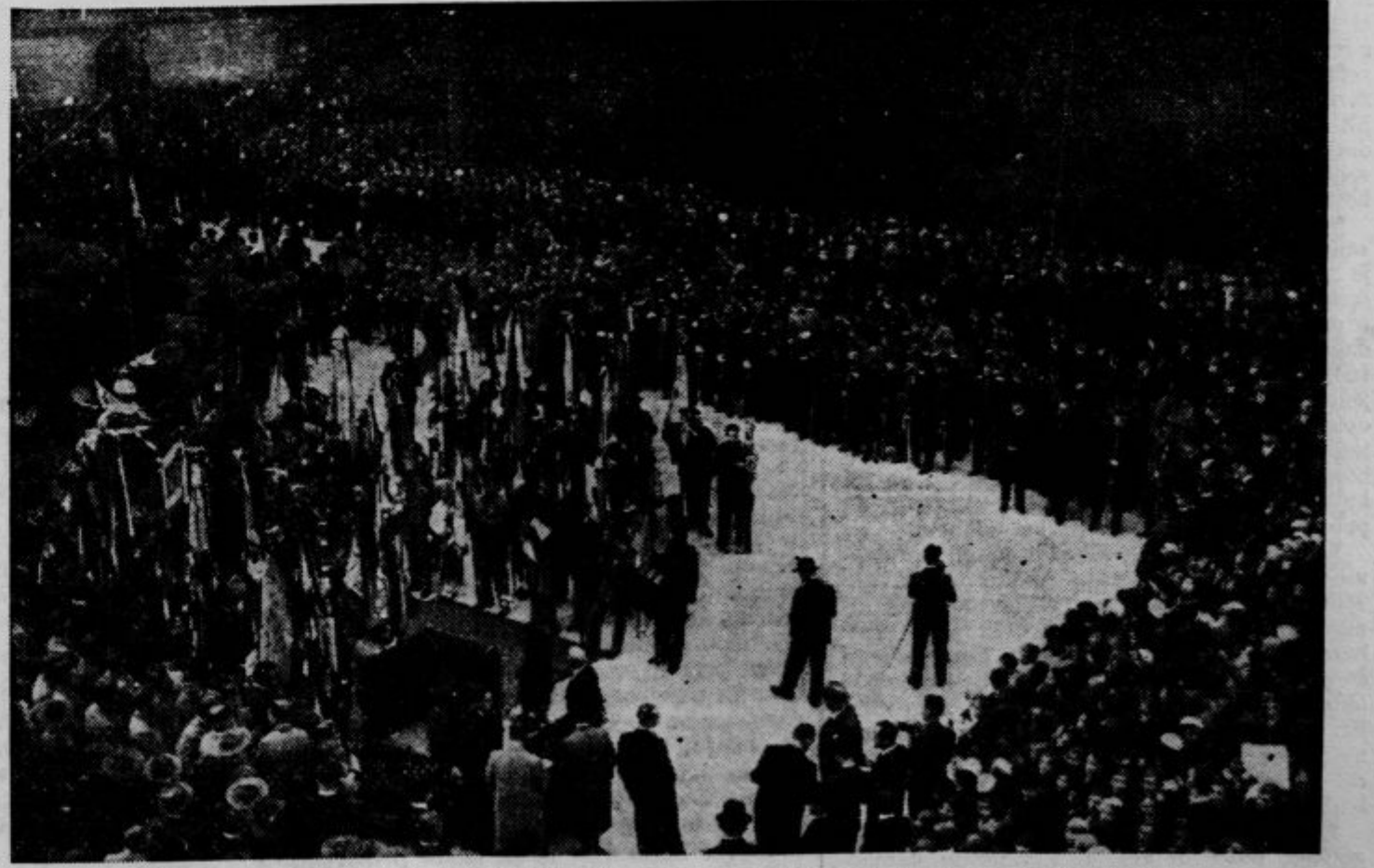
Prapori, predstavniki in deputacije okrog katafalke