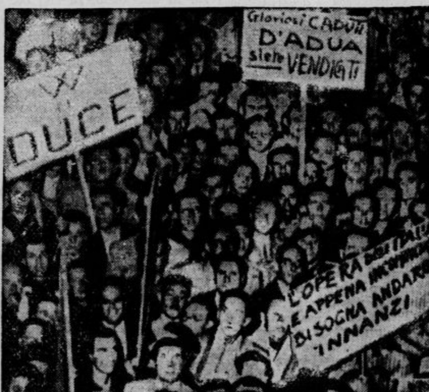
Vest o zavzetju Adu po štirdnevnih bojih je izzvala v Rimu razumljivo veselje. Pred palačo Venezia so se zbrale številne množice, ki so pripravile obhod po mestu in pri tem vikikale Mussoliniju