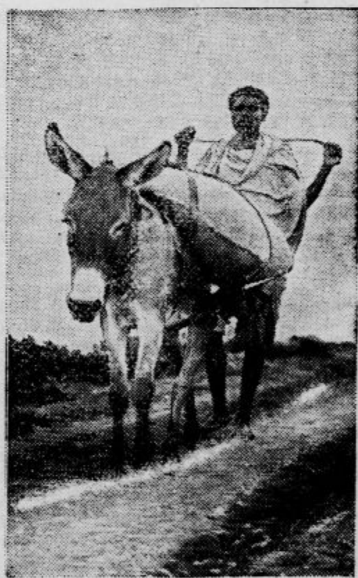
Takole oskrbujejo Abesinci svoje čete s živili za fronto