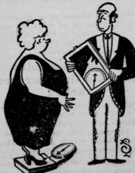
«Prosim te, drži vendar zrcalo tako, da bom lahko videla, kojsko tehtam» LeSondagisme Strizid