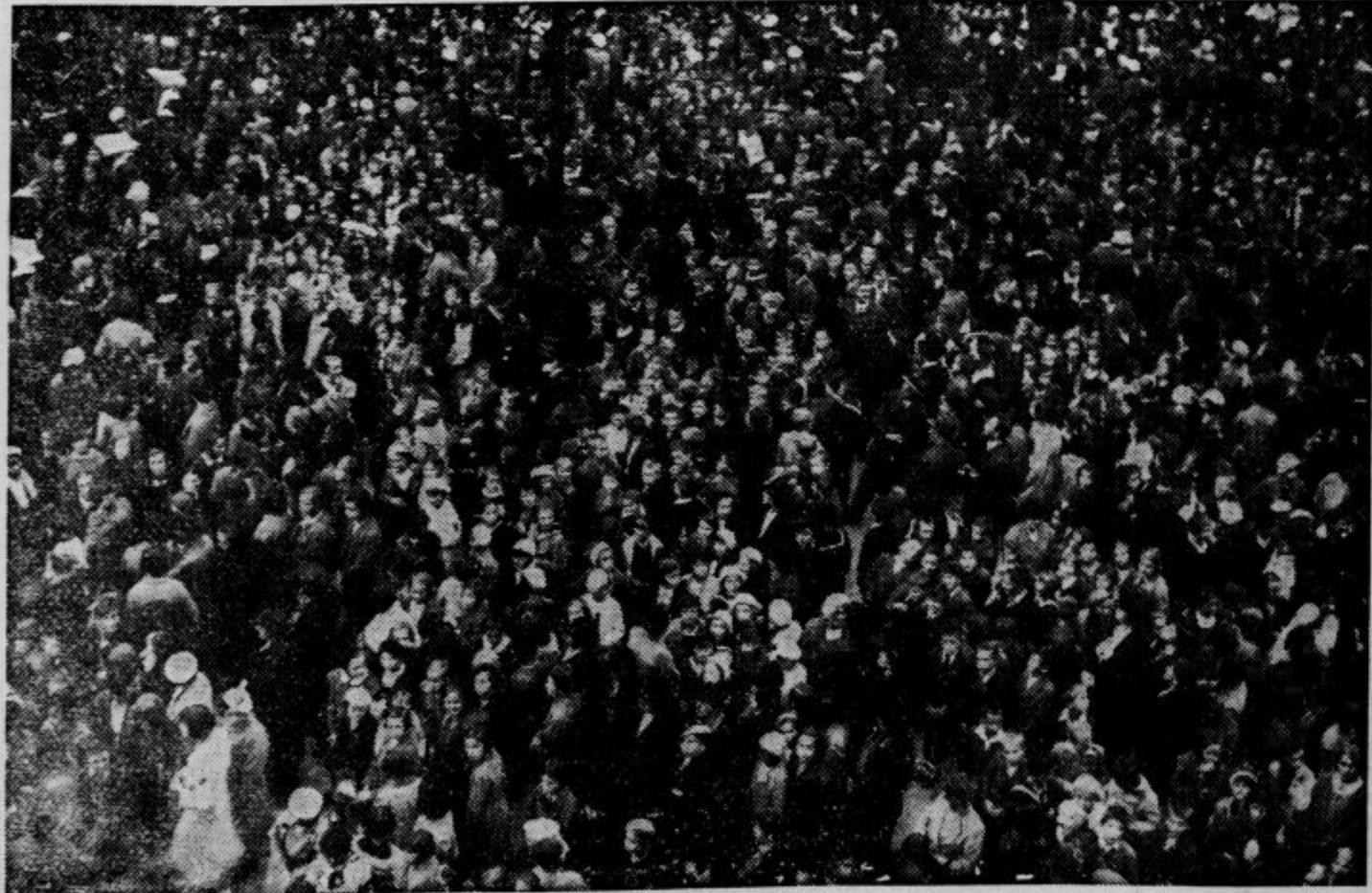
Množica pri žalni svečanosti na Kongresnem trgu