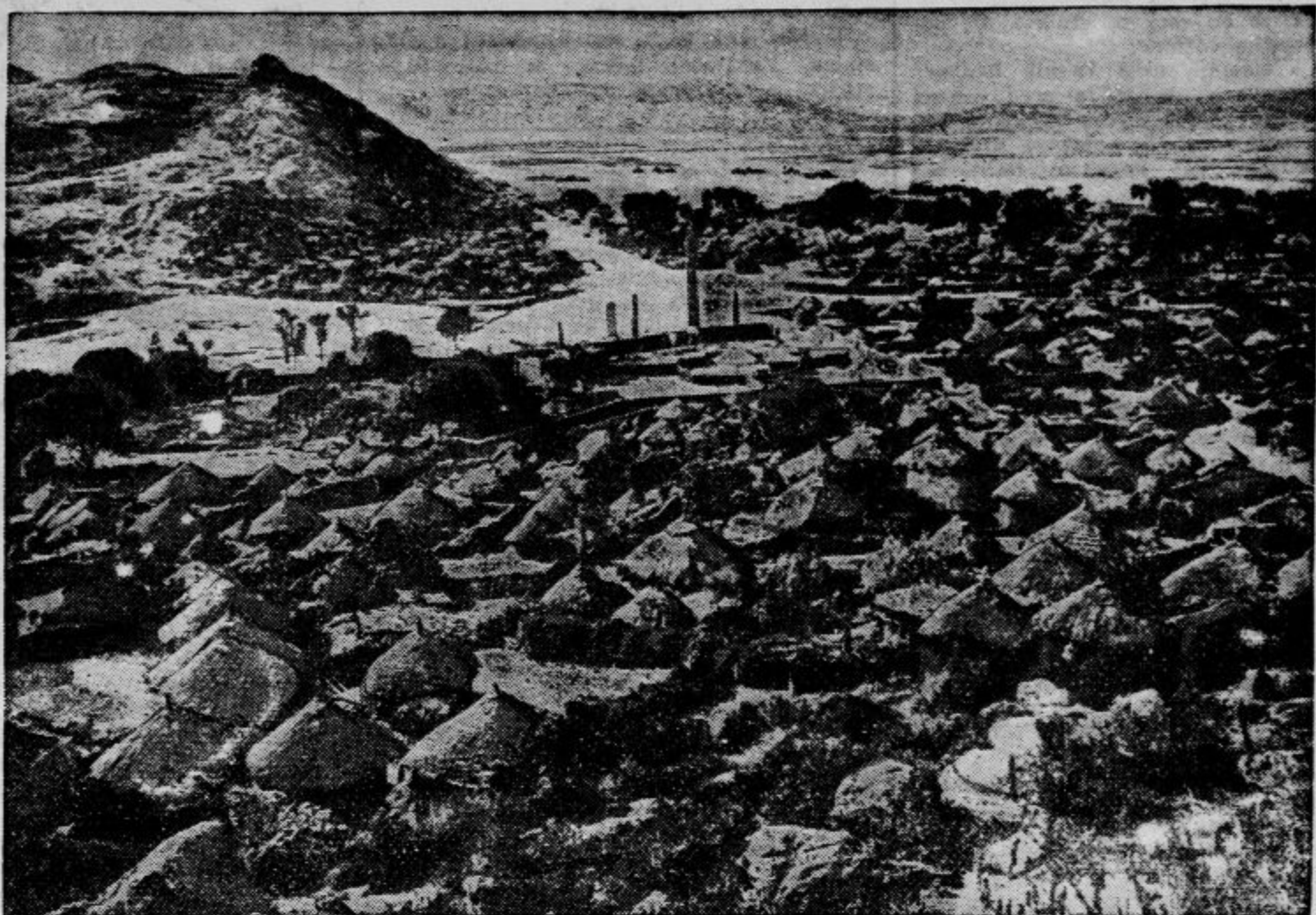
Po zadnjih vesteh so zavzeli Italijani po Adu in Adigratu tudi Aksum. Njihov generalni štab si obeta od tega poleg okrepitev strateškega položaja tudi močan moralčen učinek. Aksum je namreč eno izmed najstarejših abesinskih mest, v njem so do Haile Selassija kronali vse abesinske vladarje. Zato smatrajo Abesinci Aksum za sveto mesto. Aksum leži v zračni črti kakšnih 20 km daleč, vendar pa 600 m višje od Adu in pomeni važno pozicijo