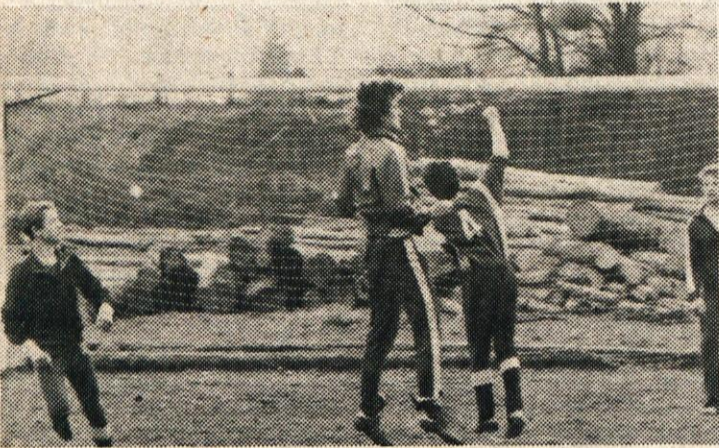
Z enega izmed treningov mladincev NK Litija

Litijski nogometaši, ki bodo v spomladanskem delu prvenstva v II. republiški ligi – vzhod nastopali izključno z mladimi igralci, so že pričeli s tekmovanjem, seveda velja to za člansko ekipo, ki za prvovrščnim Kladivarjem zaostaja za 6 točk. Sicer pa so trening tekme pred nadaljevanjem prvenstva pokazale, da je ekipa članov dobro pripravljena in lahko pričakujemo dobre rezultate, predvsem pa dobre igre na litijskem nogometnem igrišču. V pripravah na nadaljevanje prvenstva so Litijani premagali Enotnost iz Jevnice s 5:1, Savo iz Kranja z 2:0 in Kartonažno tovarno s 7:1, neodločeno so igrali s Slovanom (2:2) in Ilirijo (2:2), izgubili pa so le tekmo s Šmartnim, in sicer s 4:1.