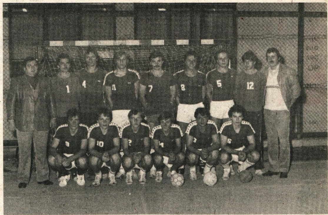
Bodo obdržali 1. mesto? Rokometaši Usnjarja se marljivo pripravljajo na nadaljevanje prvenstva v II. republiški ligi – zahod, kjer trenutno vodijo na lestvici.