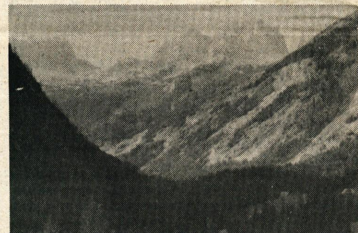
Gore privabljajo čedalje več ljudi. Saj ni čudno: pravi mir, čist zrak in veličastne lepote najde človek danes le še v naravi, ki je odmaknjena od mestnega vrveža in industrijskih središč. Na sliki: Jalovec od Kugyja

5. X. – Peca 12. X. – TRIM akcija 19. X. – Renke–Ostrež–V. Preška–Javorski Pil