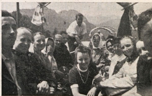
Skupina kamniškega III. reda na blejskem jezeru.