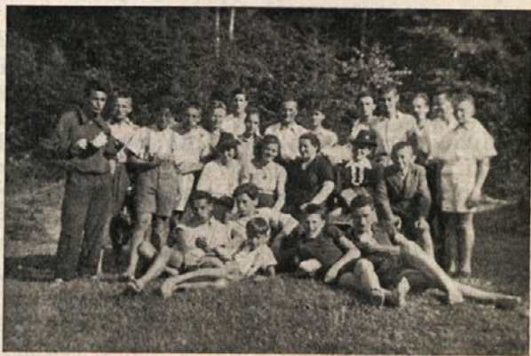
Križarji na taborjenju.

Vsi fantje so bili vsak dan pri sv. maši, ki jo imamo med tednom v podružni cerkvi sv. Lovrenca na Hotavljah. Križarji so večinoma vsak dan med sv. mašo prepevali. Letos smo začeli prvič z večglasnim petjem. Celostiriglasno smo jo že dobro urezali. Petje je privabilo vsako jutro mnogo ljudi v cerkev. P. voditelj je imel tudi v spovednici dosti dela, saj je bilo v treh tednih na Hotavljah