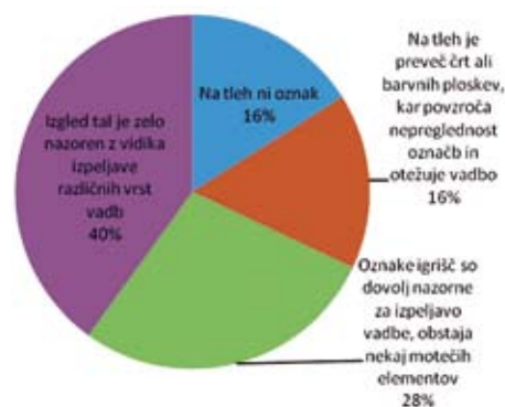
Prikaz 2: Ocena oznak igralnih površin na tleh

Dobri dve tretjini (68 %) vprašanih menita, da so oznake na tleh v njihovih športnih dvoranah dovolj nazorne za izpeljavo vadbe, 16 % na tleh nima oznak, 16 % pa poroča o prevelikem številu oznak, ki so moteče pri izpeljavi vadbe.