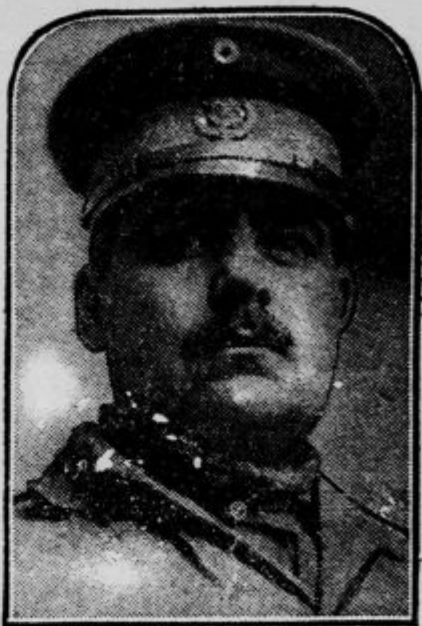
General Escobar, poveljnik mehliških vladnih čot, ki so prošle k upornikom

Ustanovitelj salezijanskega reda, don Bosco, bo, kakor poročajo iz Rima, proglašen za blažnega. Papež je že sklical tozadevni sestanek kongregacije v Vatikanu. Sklep kongregacije, da se proglaši don Bosco za blaženega se opira na dva čudeža, o katerih se domneva, da sta nastala po intercesiji ustanovitelja salezijanskega reda.