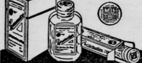
Pristne samo v originalnem zavoju "Mebler-Gesinnung".

so priznано sredstvo proti glavobolu in vročini, glavnih povzročiteljih pri tistih boleznih. —