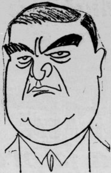
Portez Gill, mehliški državni predsednik