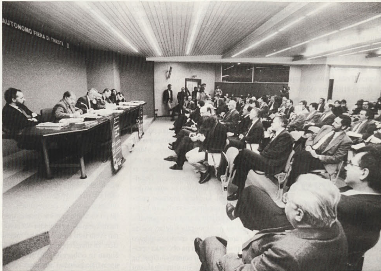
Na posvetu o sodelovanju med Italijo in Slovenijo in Hrvaško 18. let po Osimu, so poglobili vprašanja v novo nastalih razmerah, začrtali smernice za rešitev starih problemov in predložili konkretne predloge za uresničitev novih pogojev in priložnosti v korist obsejnega prebivalstva in celovitih državnih skupnosti. Natančneje bomo o tem poročali v prihodnji št. DELA.