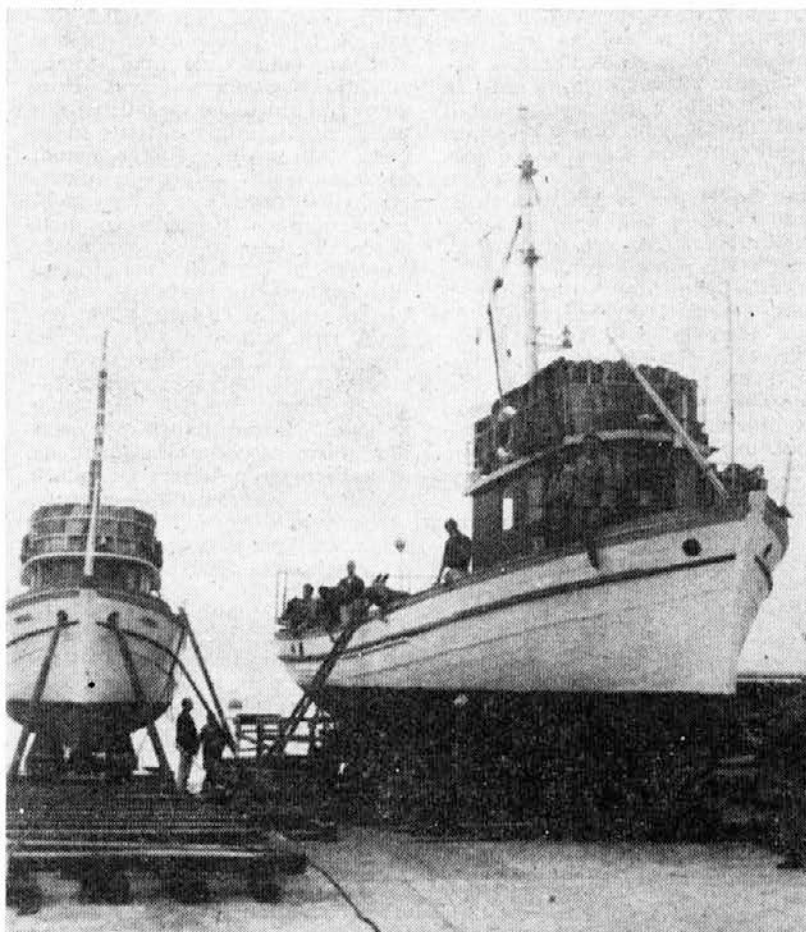
Ribiške ladje v popravilu