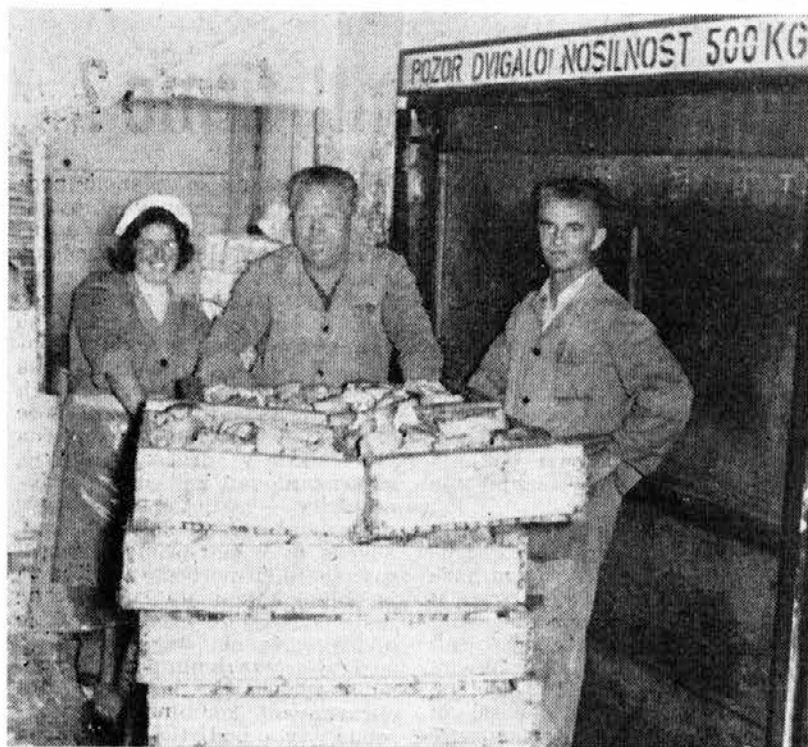
Teža ozkega grla ne bo več