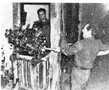
Koliko je stara stiskalnica