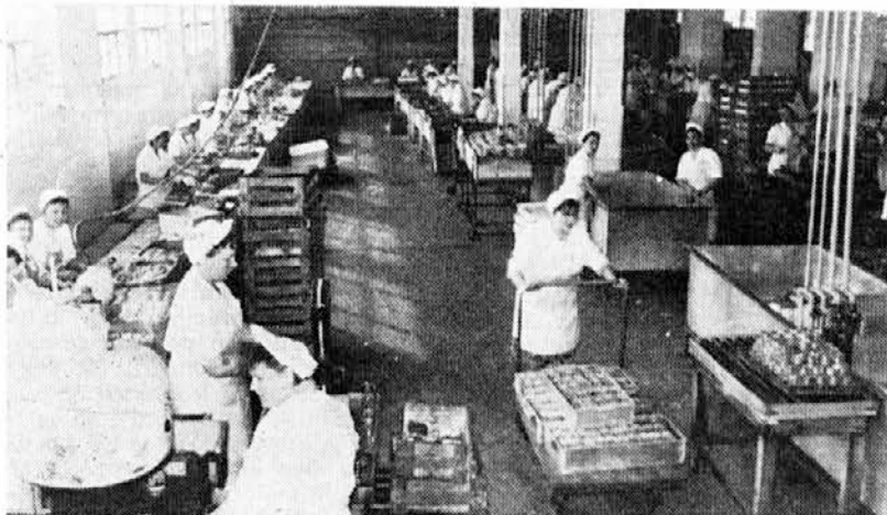
V oddelku predelave rib

Evidentiranje kandidatov nima samo namena, da bi na čim demokratičnejši način opravili volitve v predstavniške organe, ampak da bi se tudi ustvarila kadrovska evidenca za bližnje volitve političnih organizacij, delavskih svetov itd. Zato se lahko evidentiranje kandidatov opravi tudi za volilne enote, v katerih letos odbornikom ne poteče mandat.