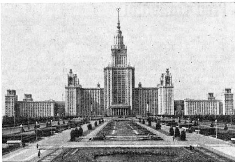
Univerza Lomonosova, ena od najimpozantnejših zgradb Moskve

Največjo skrb so nama prizadela izkušnje potovanj z našimi spalniki, ki ti v najhujši zimi postrežejo z največjo vročino ali pa te tudi pustijo precej na hladnem. Ruski spalnik je bil glede temperature, ki je vedno enaka, in glede opreme ter udobnosti res odličen. Steklenica našega konjaka je vzpostavila odličen stik z obema sprevodnikoma, ki se menjata v službi vse do Moskve. Na najin