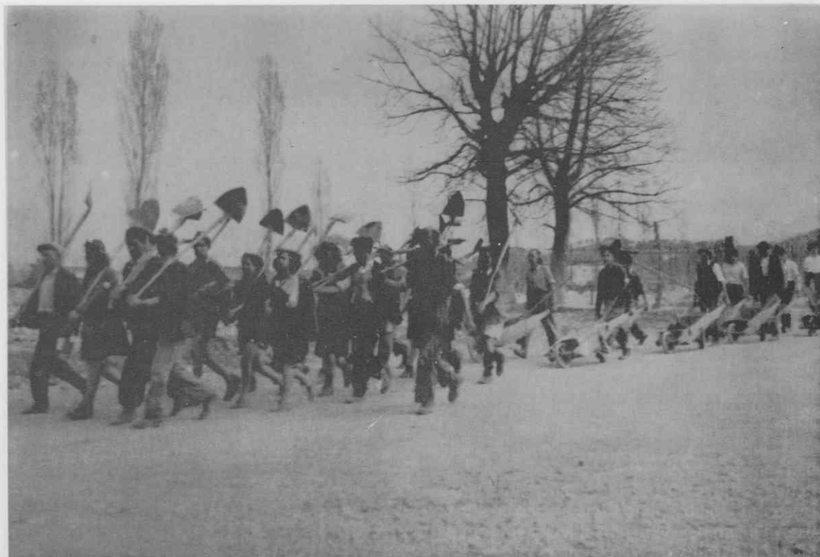
Mladina odhaja na delo

Že pred njihovim odhodom so na gradbišče prišle nove tri brigade tretje izmene: 7. MDB Hrvaška iz Slavonskega Broda (imenovali so jo tu-