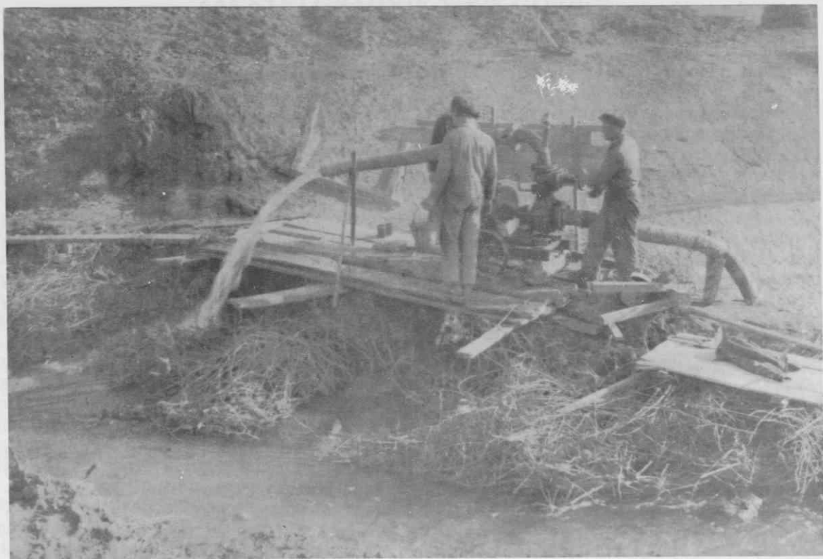
Črpanje vode, kjer se bo tlakoval potok Koren

dje trumoma odseljevali zaradi velikega presežka delovne sile in zaradi političnih razmer po nastopu fašizma v Italiji. 9