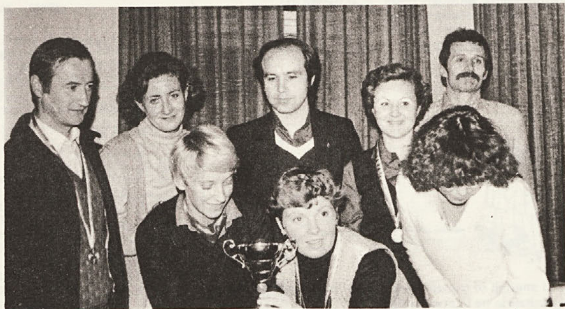
Pokal za skupno uvrstitev — III. mesto na DŠI za leto 1980 občine Novo mesto (foto: Borsan).