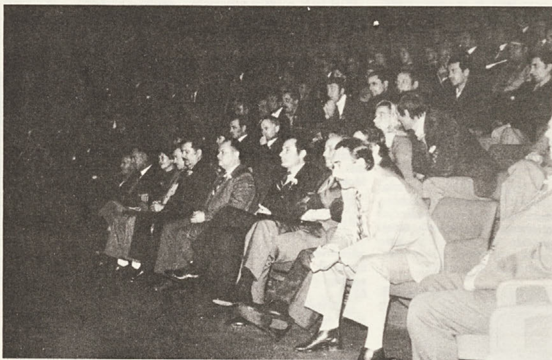
Pogled na del slavlencev na decemberski prireditvi za jubilate in upokojence ki je bila v Domu JLA v Novem mestu.

področje planiranja, delitev po delu, odnosi med TOZD,