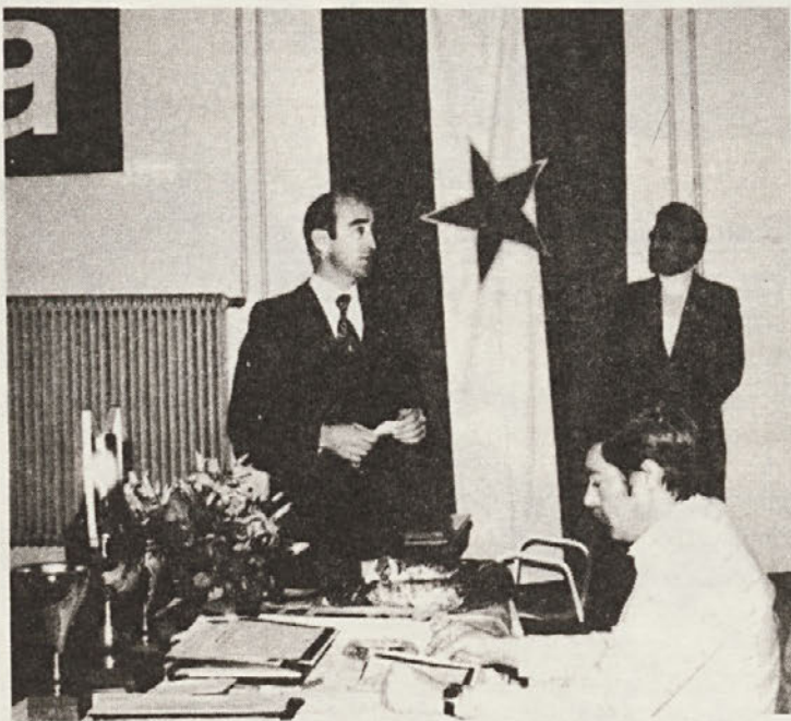
II. MEMORIAL IVANA KOČEVARJA – december 1980.