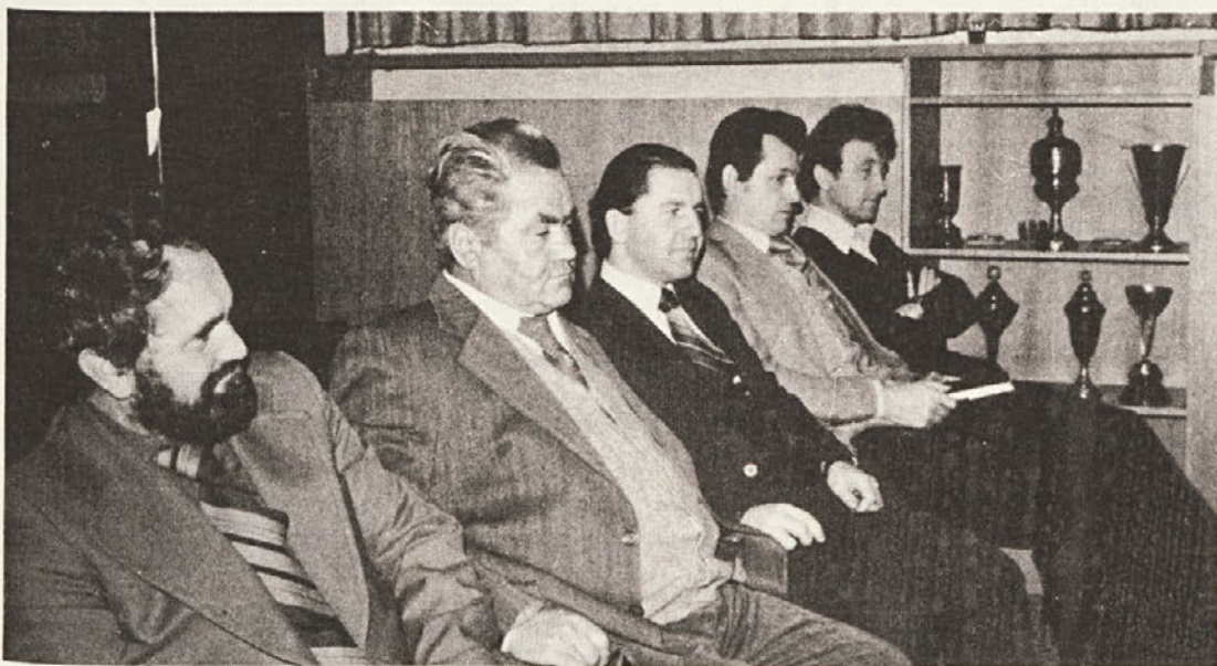
Slavnostna podelitev diplom in značk delavcem inventivnih predlogov.