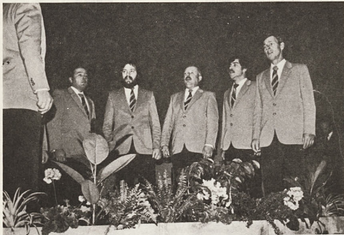
V kultumem programu na srečanju jubilarov in upokojenecv je sodeloval tudi Šentjernejški oktet.

Inventivni prijedlog je ocijenjen kao tehničko poboljšanje.