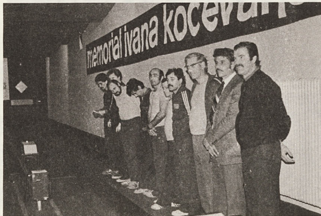
Naša ekipa na II. Memorialu Ivana Kočevarja.

Po podatkih, ki jih je zbral komite za družbeni razvoj o novomeških srednjih in poklicnih šolah za leto 1979/80, je bilo na vseh šolah 111 oddelkov s 3358 učenci. Od teh učencev jih je 3163 ali 94,2 % uspešno zaključilo šolsko leto, padlo pa jih je 5,9 %.