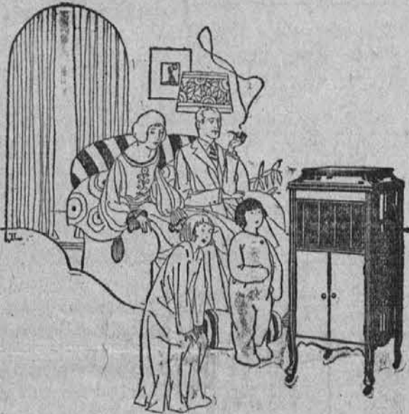
Zadnja stvar zvečer — "lahko noč" za otroke. Sladka pesmica jih bo hitro zazibala v spanec.