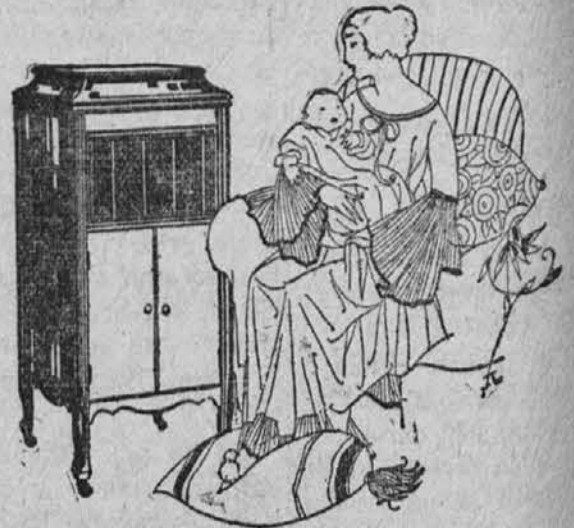
Materine zibalne pesmice ob mraku! Kaj izraža toliko ljubezni in občutka kot uspavalna pesmica. Columbia rekordni zibalnih pesmic so tako podobne materinemu pevanju kolikor more godba sploh slična biti.

SEDAJ JE PRILOŽNOST da pridete do resnično dobrega inštrumenta na katerega boste lahko tudi ponosni. Zabaval bo vas, vašo celo družino in prijatelje. Da vam pomagam, vam bom postavil eno izmed teh grafonol v vašo hišo. Na stotine rojakov, vaših sosedov, je kupilo na ta način.