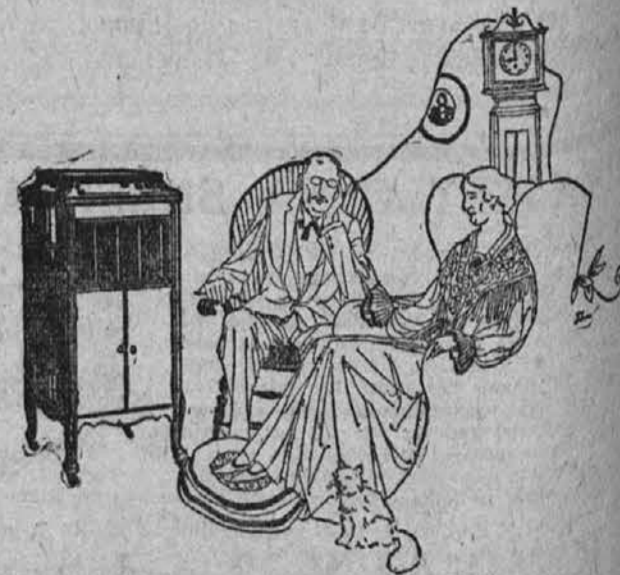
Ko sveča življenja že slabotno brli, vam prinese godba zadovoljstvo in udobnost v hišo ter napolni sture leta z pesmimi izza davnih dni.

Samo pridite pogledati in spoznali boste, da je vse gornje resnično.