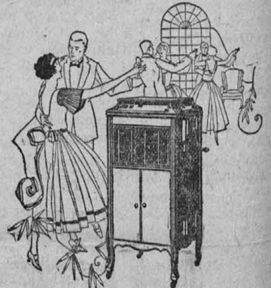
Zvijte skupaj preprogo, navijte grafonolo in plešite. Vsak bo vskliknil, "Ah, ta je bila pa res lepa! Zaigrajte jo vendar še enkrat."

Samo izberite si grafonolo iz lesa in barve kakoršno mislite, da bo najbolj pristojala v vaš dom, ter naredite prvo plačilo, ostalo pa plačajte na ugodne obroke. To je vaša prilika. POTRUDITE SE SEDAJ.