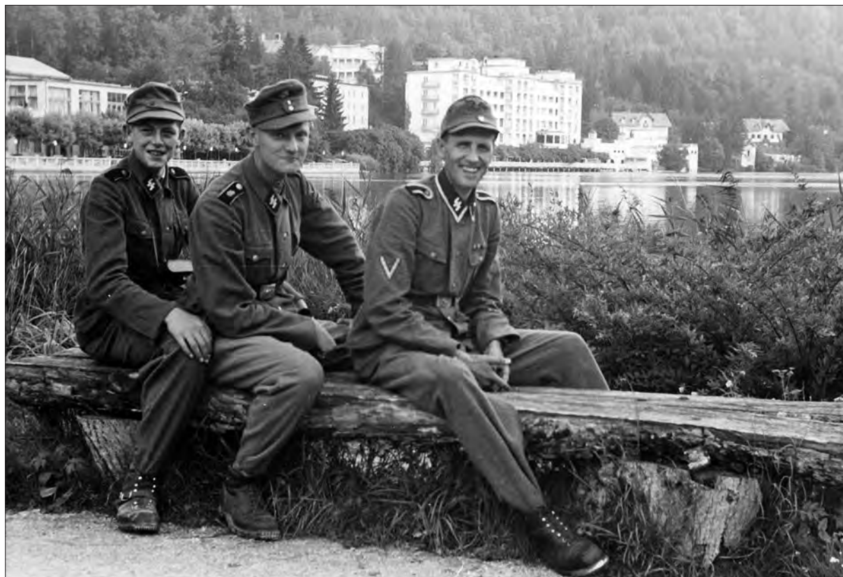
Trije esesovski vojni fotoreporterji na Bledu (hrani Muzej novejšje zgodovine Slovenije; inv. št. Š36/543).

ki, uporabljali pa so še poštni avtomobil. 20 V blejskih Zagoricah so konec oktobra 1944 opazili 12 poštних stražarjev, ki so bili nedvomno tja poslani za okrepitev blejske izpostave. 21