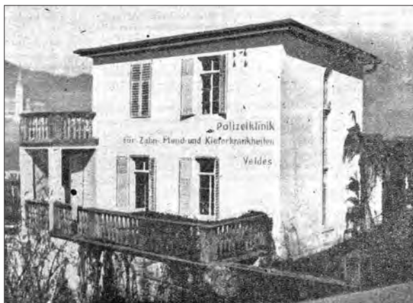
Fotografija policijske otorinolaringološke klinike na Bledu (Die Deutsche Polizei, letnik 11, 1. 3. 1943, št. 5, str. 89).

V sklopu večjih protipartizanskih operacij na Gorenjskem je Bled občasno doživel večje premike policijskih in (para)vojaških enot, ki so se okrepile predvsem v zadnjih mesecih vojne, ko so se nemške enote pričele umikati. Konec januarja 1945 so obveščevalci na Bledu zabeležili: radijskooddajno postajo polka Brandenburg s posadko petih vojakov v vili Iris, 2. četo istega polka na golf igrišču, 3. četo v hotelu Zaka in 4. četo istega polka v hotelu Petran, štab polka v hotelu Golf (pri čemer sta poveljnik in adjutant prebivala v hotelu Toplice), štab 1. bataljona polka Brandenburg v vili Justinraj, 18. (težko) četo tega polka v hotelu Istorija in župnišču, varnostno policijo in službo v Park hotelu, 181. policijsko gorsko-komunikacijsko četo v hotelu Central ter vilah Melita in Ivana, odred službenih psov v dvorskih garažah, esesovsko sodišče v Park hotelu (pri čemer so zaposleni stanovali v hotelu Toplice), esesovski lazaret in okrevališče v hotelu Toplice, policijsko ambulanto v hotelih Wölfling in Splendid, konjeniško četo polka Brandenburg in vojaško mehanično delavnico v dvorskih garažah, glavno vojaško skladišče v Sokolskem domu, ruske prostovoljce v vili Pogratz in hotelu Troha, eno četo 184. deželnostrelskega polka ( 184. Landschutz-Regiment ) na železniški postaji Bled-jezero, v hotelih Evropa in Triglav ter drugo četo istega polka na lisičji farmi pri savskem mostu in golf igrišču, protiletalske opazovalce v gostilni Ambrožič ter motoriste v hotelu Petran. 65