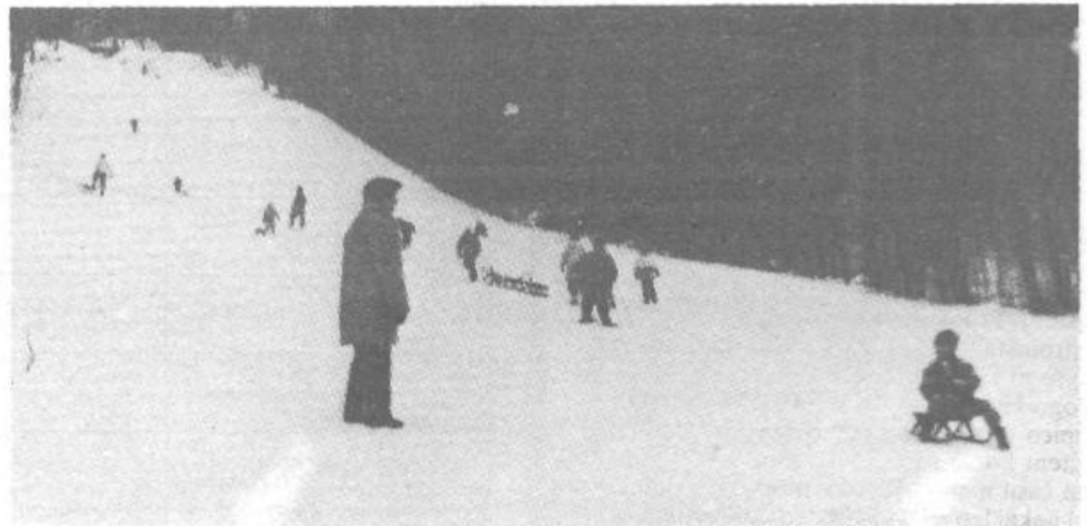
Z letošnjim snegom je smučišče v Rožni dolini spet oživeło