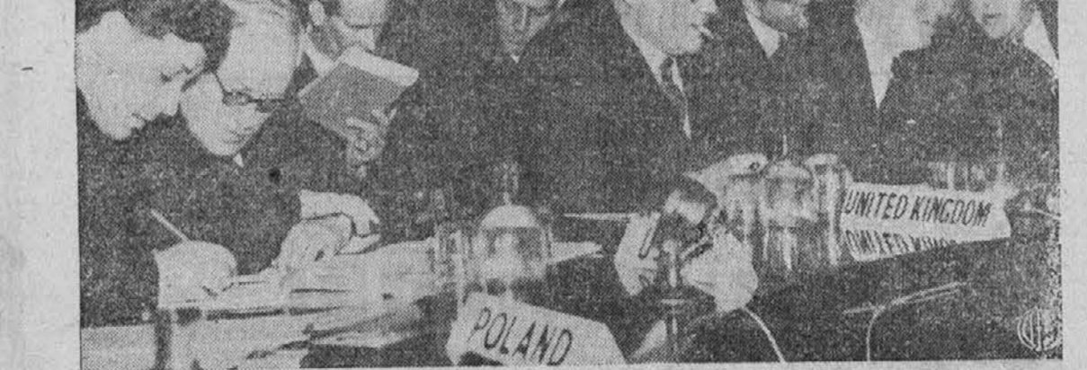
Gornja slika nam nudi prizor iz seje zastopnikov Zdrženih narodov v Londonu. Slika je bila posneta v času, ko je bilo v razpravi grško vprašanje. Levi na sliki (z očali) je Andrei Vishinsky, sovjetski podkomisar za zunanje zadeve; v sredini slike (s cigareto v ustih) je britski zunanji minister Ernest Bevin, na desno (svolasi) je ameriški delegat Edward Stettinius, ki se pogovarja z Trygve Lie-jem norveskim delegatom, ki je obenem tudi glavni tajnik organizacije Zdrženih narodov.