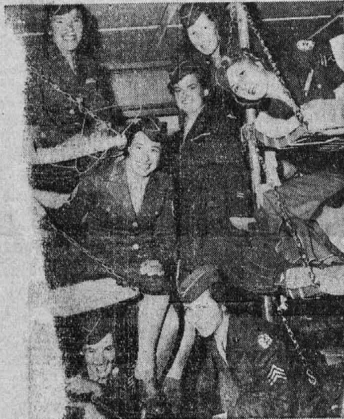
Gornja slika nam predstavlja del zadnje skupine ...