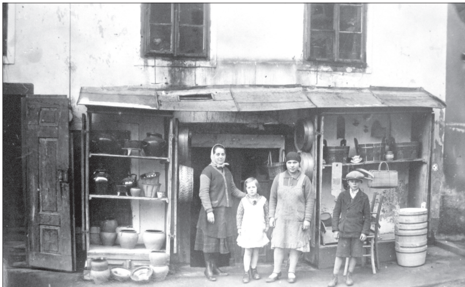
Trgovina metliškega trgovca okoli leta 1935. Pred njo stojijo: od leve trgovčeva žena, hči in služkinja iz okolice Semiča ter sosedov fant.