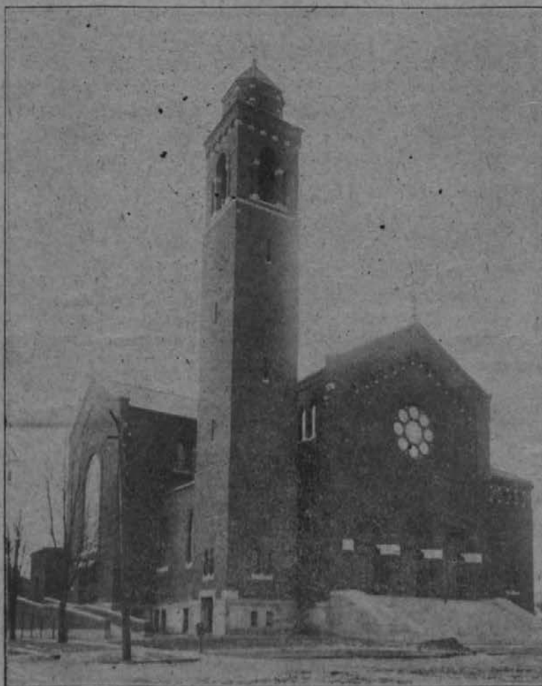
Romarska cerkev "Marije Tolažnice Žalostnih" v Carey, O.