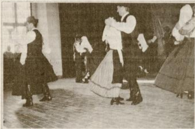
"Slovenci imate čudovite plesne," je vzklikala nizozemska gledalka

Sedem (ne) pomembnih dni / Sedem (ne) pomembnih dni