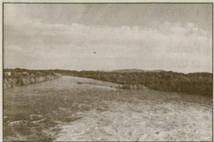
Divjanje voda Drave za jezom v Markovcih v ponedeljek, 8. julija, ob 18.32 minut.

V ponedeljek, 8. julija, popoldne je Center za obveščanje iz Maribora obvestil Upravo za obrambo Ptuj, da se je zaradi predhodnih izredno izdatnih padavin v Avstriji na mariborskem območju nenormalno in v kratkem času dvignil nivo reke Drave. Zato so takoj opozarili tudi občane ob strugi Drave na ptujskem območju, predvsem v spodnjem delu od markovskih zapornic proti Zavrču, naj bodo pozorni in pripravljeni na morebitni dvig vodostaja ali celo na poplave.