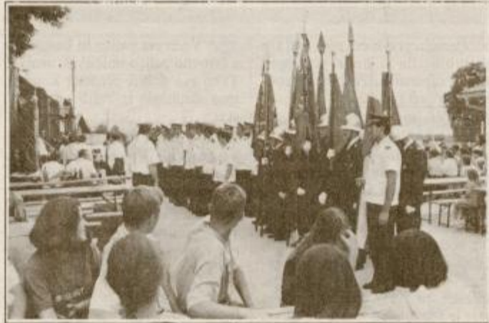
Visok jubilej je pred gasilskim domom v Jablanah počastilo blizu 100 gasilcev iz sosednjih in sodelujočih društev.

Ob 110-letnici so gasilci iz Jablan izdali spominski bilten in veliko jubilejno značko. Na nedeljskem slavlju so jim čestitali tudi gasilci iz GD Nedelišče, s katerimi že nekaj let uspešno sodelujejo. Štirim najzaslužnejšim