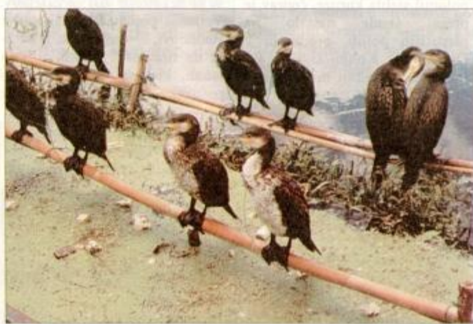
Ribič s kormorani

bliskovito končala v ustih moidočega berača, ko sem mu pokimala, da jo lahko vzame. Kitajska ni Indija. Takšnih prizorov nismo bili vajeni, zato so bili prava hladna prha.