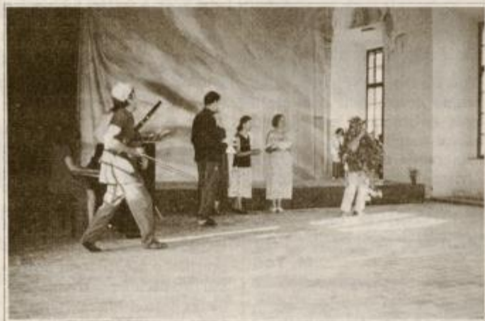
Oder v viteški dvorani je znova zaživel. Utrinek iz opere Čarobna piščal