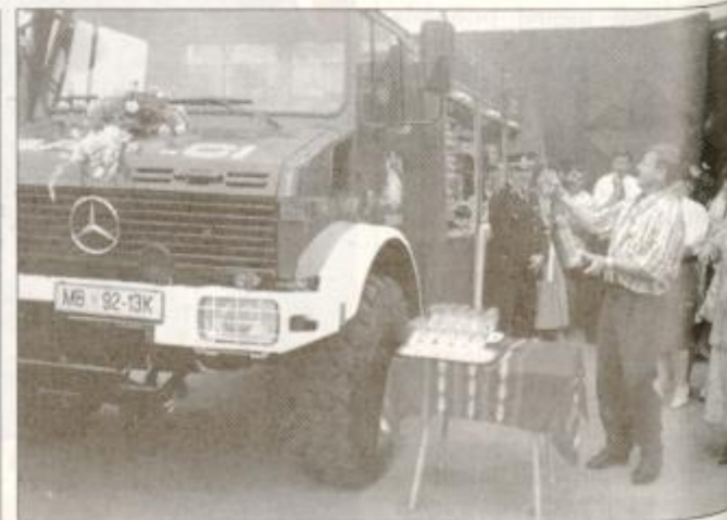
Novo gasilsko vozilo so krstili s steklenico penine