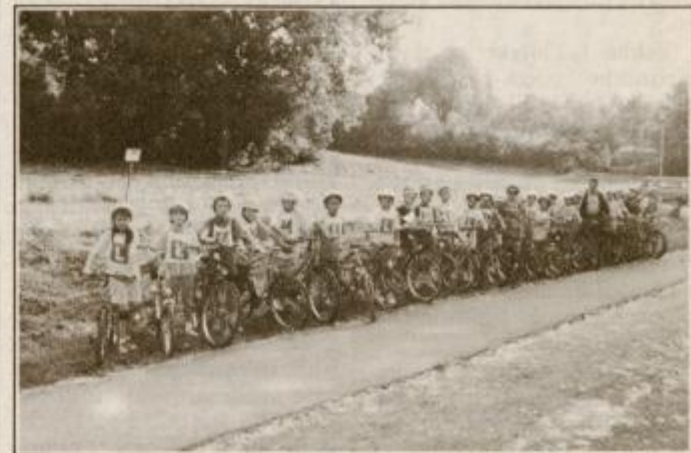
Bistro glavo varuje čelada

napori vseh vzgojnih dejavnikov vzgojili zavestno disciplinirane učence - pešca, kolesarja, mopeda in kasnejšega voznika motornega vozila.