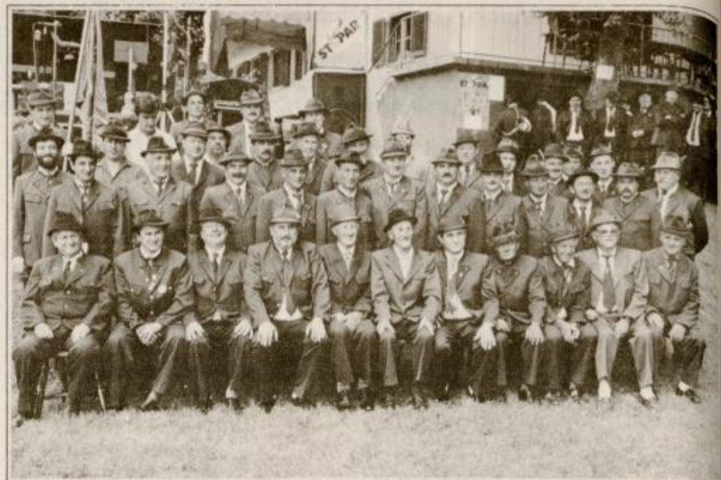
Juršinska zelena bratovščina je praznovala Abrahama