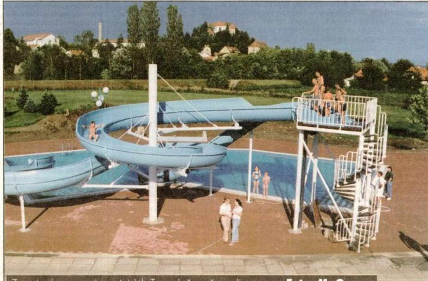
Z novim bazenom je v ptujskih Termah še več veselja.