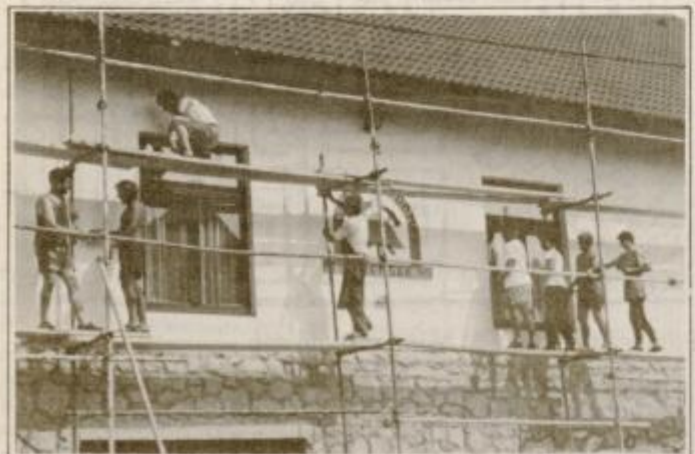
Gasilci so vse delo opravili sami

Polenškak, ki šteje 125 članov, in nekateri vaščani lotili dela. Tako