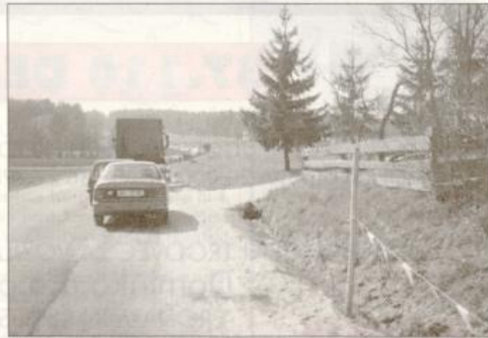
Konec dolgih kolon pred Lenartom.

obnavljati še magistralko skozi mesto. Letos naj bi se začelo - če se seveda ne bo zataknilo pri denarju.