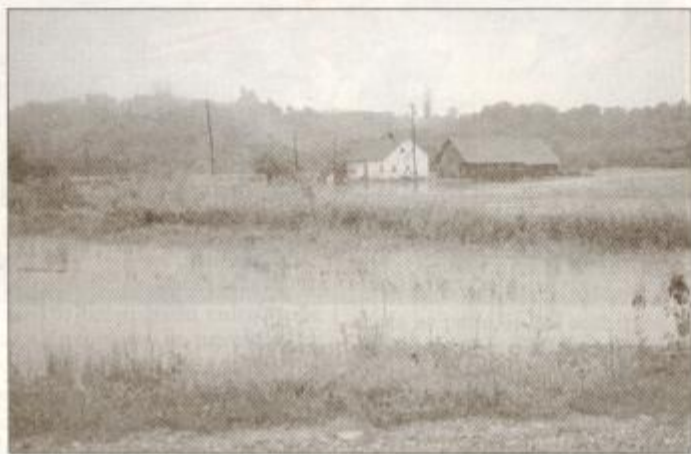
To je le eno od poplavljenih območij v občini Destrnik - Trnovska vas, kjer je voda ogrozila stanovanjsko hišo.

rasla reka Pesnica, ki je poplavlila na običajnih mestih pred Hrastovcem, Lormanjem in Šetarovo. Tam je voda zalila veliko njiv in travnikov, na srečo pa tokrat ni ogrozila življenja ljudi. Narasla je tudi Globovnica in se pred Lenartom razlila po travnikih ob Poleni. O naraslih vodah so poročali tudi od Svete Ane, iz Žerjavcev, Zgornjih in Spodnjih Verjan in še iz nekaterih vasi in zaselkov. Velka je poplavlila nekaj njiv v Radehovi, Drvanja pa se je razlila na nekaterih mestih v Verjanah, kjer so bili poplavljeni pašniki. Večje škode tokrat