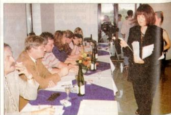
Komisija je pri dekletih ocenjevala obraz, noge, hoke in postavo kot celoto.

dijakinja ekonomske šole iz Ptuja: "Nad uvrstitvijo sem zelo presenečena, nisem je pričakovala. Skratka, srečna sem."