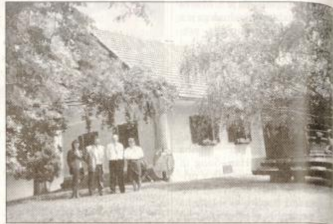
Na Švabovem ponovno gostje.