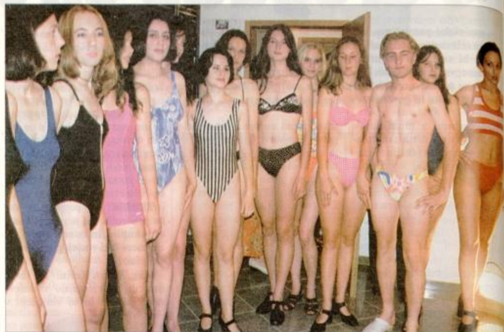
Avdicije so se udeležila lepa dekleta (in fant) iz številnih slovenskih mest: Maribora, Murske Sobote, Ptuja ...