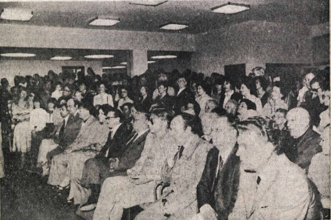
Pogled na publiko med nastopom otrok v notranjosti šolskega poslopja