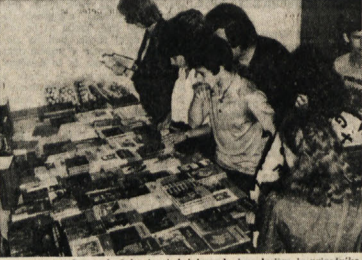
Dijaki slovenske strok. šole si ogledujejo podarjene knjige in priročnike

Slovenska strokovna šola v Trstu ima od včeraj svojo knjižnico. Na novoustanovljeni šoli, ki skrbi za poklicno usposabljanje naše mladine, je namreč sekretariat za vzgojo in izobraževanje Socialistične republike Slovenije podaril večje število leposlovnih knjig in tehničnih priročnikov, iz katerih bodo lahko sedaj dijaki črpali snov za o bogatitev svojega znanja, kar pomeni potrjuje skrb in napore, ki jih vlagajo šolske oblasti v matični domovini za razvoj zamejskega šolstva.