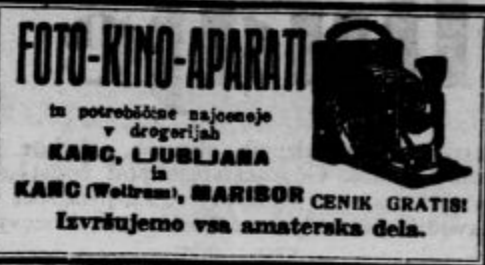
FOTO-KINO-APARATI in potrebne najemne v drogerijah KANC, LJUBLJANA in KANC (Wolman), MARIBOR CENIK GRATIS Izvirujemo vsa amaterska dela.