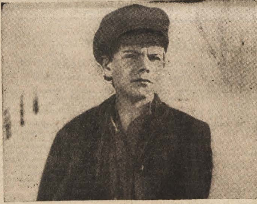
Iz filma »Mladost Maksima Gorkega«.

Vse množične organizacije Osvobodilne fronte naj mobilizirajo svoje članstvo za teden zbiranja odpadkov. Naša mladina naj tudi tu pokaže svoje veliko dejavnost, posebno pa še naša antifašistična fronta žena, da mobilizira vse svoje sile in organizira vse slovenske žene za zbiranje v vsaki ulici, v vsaki vasi. Ta akcija mora zajeti tudi najoddaljenejšo in najbolj osamljeno domačijo. Vsako gospodinjstvo ima nekaj nerabnih cunj, krp in podobnih stvari. K tej zbiralni akciji naj pristopijo tudi vse ostale ustanove in organizacije in naj začnejo takoj s pripravami. Ne smemo tega odlašati na sam zbiralni teden, temveč moramo izvesti priprave že prej do vseh podrobnosti, do pritegnitve vsakogar, da se bo akcija zbiranja pričela pravočasno in da bo njena izvedba temeljito opravljena. Vsak pionir, vsak mladinec, mladinka, vsak član Osvobodilne fronte, delavec, kmet, inteligent, vsak naj po svojih močeh doprinese k čim-boljši in uspešnejši izvedbi te važne akcije za naše gospodarstvo.