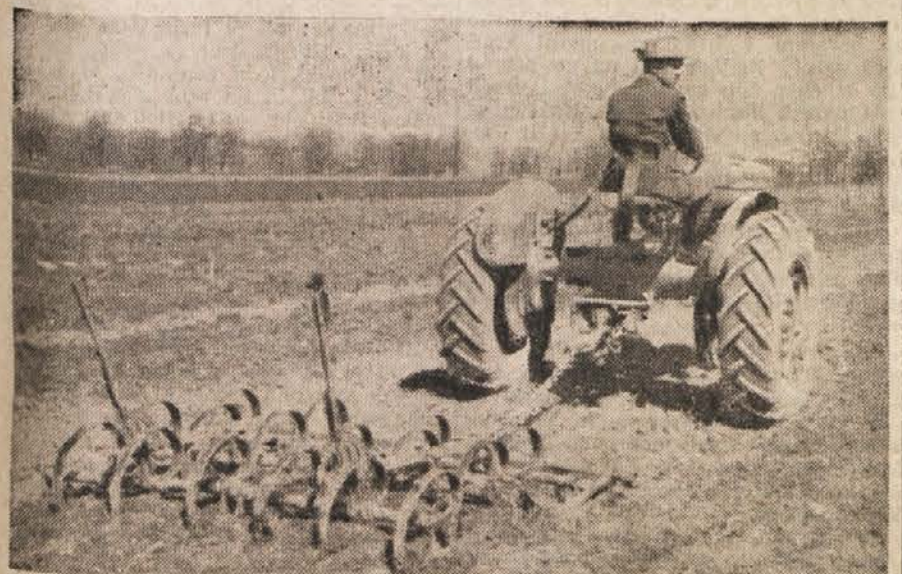
Traktor vleče peresni kultivator, ki z jeklenimi peresi ruje iz tal njivni plevel — ruico. Z uporabo peresnega kultivatorja bodo pridobili 50% delovnega časa.

Tako so se slovenski rudarji odzvali novoletnemu pozivu maršala Tita in se pridružili tekmovanju rudarjev, kakor tudi delavcev in nameščenec drugih strok vse države. Uspehi tega tekmovalnega se kažejo iz meseca