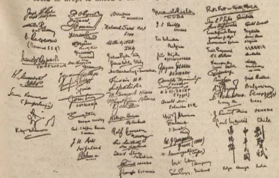
Podpisi predstavnikov mladinskih organizacij na ustanovni listini Svetovne federacije demokratične mladine.