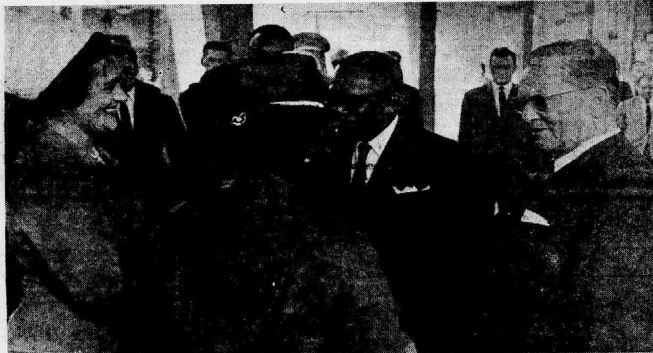
PRISRČNO SLOVO DVEH PREDSEDNIKOV — Včeraj zjutraj, nekaj po osmi uri, se je predsednik republike Josip Broz Tito poslovil od svojega gosta, predsednika Liberije Tubmana in njegove soproge, na železniški postaji v Ljubljani. Predsednik Tubman je s spremstvom odpotoval z vlakom na Dunaj po petdnevnem obisku v Jugoslaviji, med katerim je obiskal Beograd, Zagreb, Reko, Opatijo, Brione in Slovenijo. Na Brionih je nadaljeval razgovore s predsednikom Titom in njegovimi sodelavci. Slovo na železniški postaji v Ljubljani je bilo zelo prisrčno. Na sliki: predsednik Tito in njegova soproga v razgovoru s predsednikom Tubmanom in gospo Tubman pred odhodom vlaka.