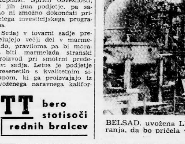
BELSAD, uvožena LUWA naprava čaka kompletniranj, da bo pričela vracati vložene investicije