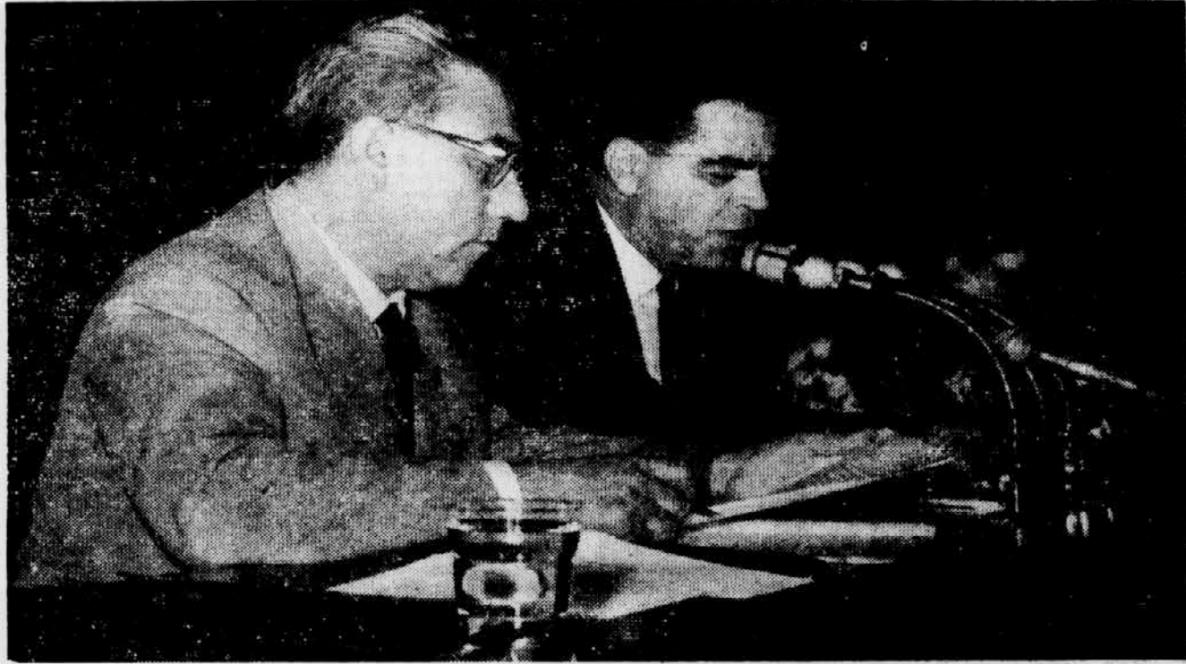
S PLENARNEGA ZASEDANJA ZVEZNega ODBORA SZDLJ JUGOSLAVIJE — Veljko Vlahović bere uvodni referat, levo je Aleksandar Ranković, desno Lidija Sentjurc.

Plenum je razpravljati tudi o kandidaturi za podpredsednika republike in predsednika zvezne skupščine ter sklenil, da bo predlagal za kandidata za podpredsednika republike Aleksandra Rankovića, za kandidata za predsednika skupščine pa Edvarda Kardelja.