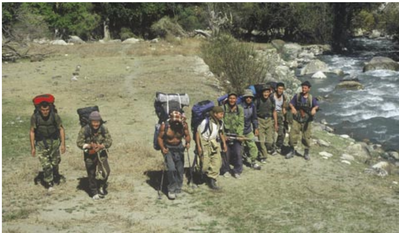
Slika 2: Na širšem mejnem območju med Kirgizistanom in Tadžikistanom potekajo občasni spopadi med obmejnimi vojaškimi patruljami in tihotapci drog. Preko območja namreč vodi glavna transportna pot za droge iz Afganistana in Tadžikistana na ruski in evropski trg.

Poleg teh strukturnih razlogov, ki v glavnem odsevajo nasprotja znotraj območij, lahko nastanek kriznih območij sprožijo tudi zunanji dejavniki. Tako povzročijo agresije sosednjih političnih enot ali širših družbenih skupin, ki želijo drugačno razporeditev dobrin (rudna bogastva in energetske viri, rodovitne površine, čedalje bolj tudi vodni viri ipd.), nadzor nad ozemljem in njegovimi strateškimi prvinami, širitev gospodarskega, političnega ali ideološkega vpliva, trajnejše strukturne spremembe na napadenem območju in s tem oblikujejo novo krizno žarišče. Velike sile so si zaradi strateških razlogov privoščile t. im. "preventivni udar", ki naj bi preprečil njim neželen razvoj na območjih oziroma v državah, ki so jih opredelili kot strateško pomembne. To so bile različne vojaške intervencije, pogosto načrtovane kot kratkotrajni, začasni ali celo zgolj svarilni ukrepi, a so se potem razvlekli v večmesečno ali celo večletno klasično bojevanje in gverilski odpor.