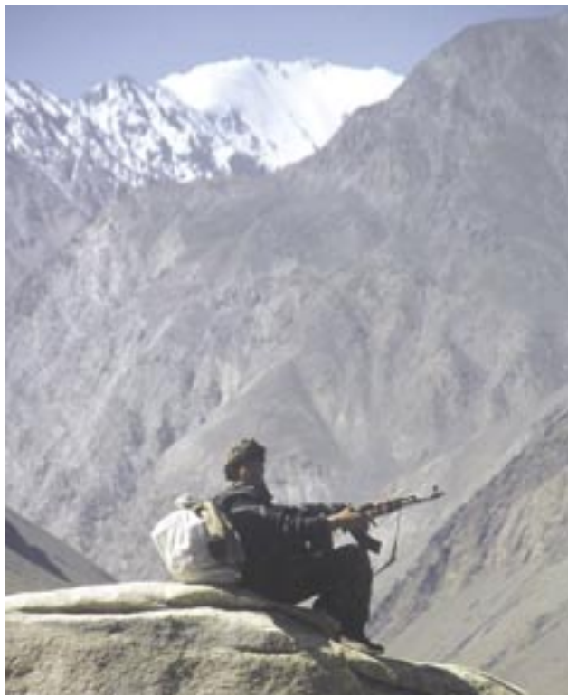
Slika 3: Vasi v Vakhanskem koridorju branijo prave "vaške vojske". Uporabljano orožje je pretežno ruske izdelave.

vzroke krize ter njihove družbene in prostorske posledice. Ta pretežno induktivna pot analize nam omogoči spoznati probleme in procese na kriznem območju. Raziskovalna pot nas vodi verižno od znanega k