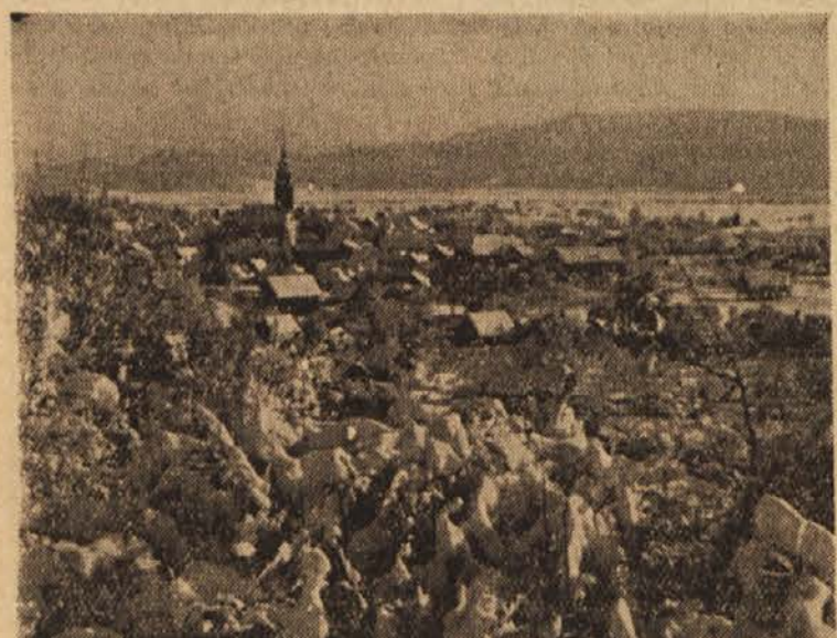
Pogled na Cerknico

Občinski ljudski odbor v Cerknici pa žuli še ena težava: gostinstvo in turizem. Cerknica je znana s svojimi naravnimi zanimivostmi in lepotami (Križna jama, Slivnica, Cerknikiško jezero). Toda doslej še nimajo hotela, kjer bi lahko turisti prenočevali. V ta namen preurejajo bivše sodišče, toda za preureditev sodišča v sodoben hotel bodo potrebovali okrog 8 milijonov dinarjev. V Cerknici bo nujno obnoviti turizem, saj bi s tem zagotovili prebivalcem zaposlitev, vsemu kraju pa lep dohodek. Kljub prizadevanju ljudskega odbora se pa to vprašanje ni premaknilo z mrtve točke. I. L.