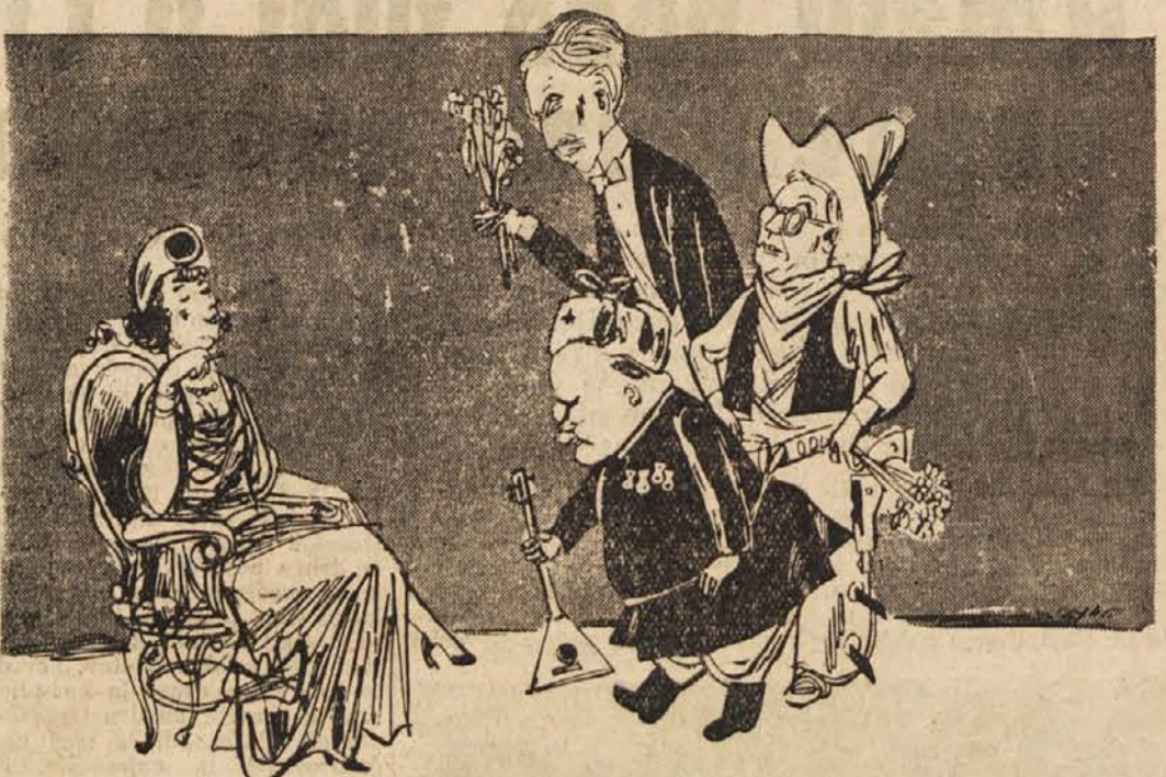
ZAHODNA TOLMACENJA BERLINSKE KONFERENCE