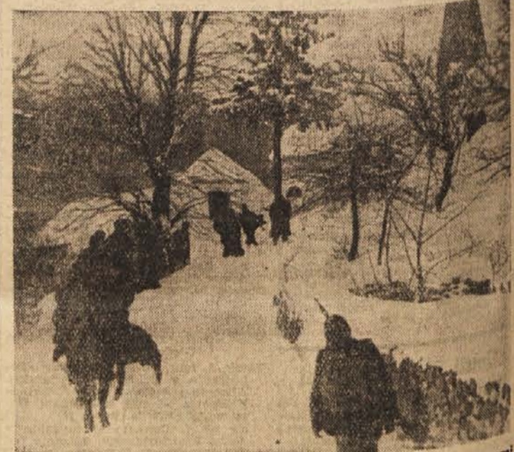
XIV. divizija na Stajerskem februarja 1944. leta. Po eni strani gazi so hiteli borci naprej mimo vasi, ustavljati se niso smeli nikjer. Nemci so jim bil ves čas za petami

že leta 1952 sklenjeno, da bodo odobrili tehničnemu muzeju dotacijo v znesku 1 milijon dinarjev, komunalni oddelek istega podjetja pa je tudi ponovno obljubil, da bo dobil muzej prostore v bivši Ruardovi graščini. Ostalo pa je le pri obljubah in danes, v začetku leta 1954, muzej še vedno nima prostorov. Prav bi bilo, da bi jih dobil vsaj letos.