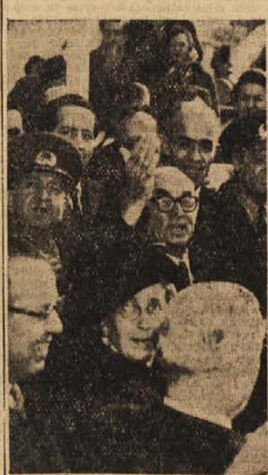
Predsednik turške vlade Celal Bayar se mudi v ZDA. Dne 27. januarja je bil sprejet tudi v Beli hiši v Washingtonu.

Saigon, 8. febr. (AFP). Ho Si Minhove enote so zasedle dolini rek Nam Hou in Nam Suong, ki se zlivajo v Mekong severneje od Luang Prabanga. Vietminški enote so opazili 30 km severno od tega mesta. Obveščeni krogi sodijo, da je moč pričakovati boje za Prabang v prihodnjih dneh.