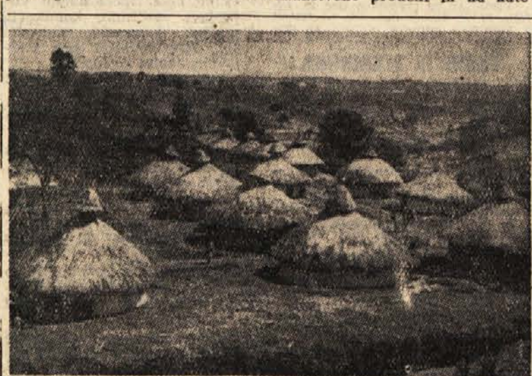
V Keniji se britanske kolonialne oblasti še vedno bore proti uporabi plemenu Kikuyu oziroma organizaciji Mau Mau. Zdaj so mnoge pripadnike tega plemena prisilno naselili v rezervatih. Nova bivališča so si morali zgraditi sami...

Iz znane Einsteinove formule o zvezi med maso in energijo je videti, da celo neznatni masi ustreza ogromna količina energije. Če bi se nam posrečilo sprostiti energijo, ki ustreza masi enega grama katerekoli snovi (bakra, vode ali podobno) bi bila enaka energiji, dobljeni z zgoraj omenjenim 3000 ton najboljše premoga.