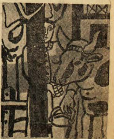
Fernand Seger (Ecole de Paris): Kompozicija, 1953, barvna litografija