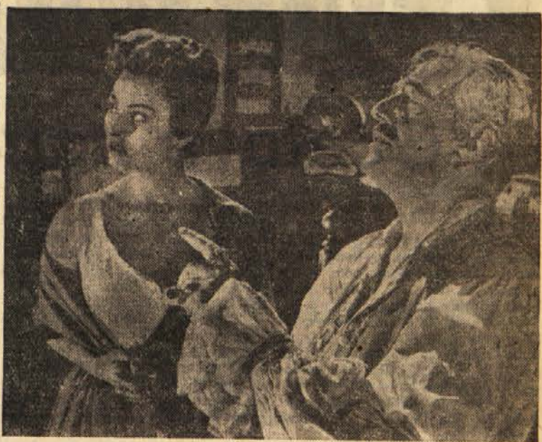
Sophia Loren in Vittorio De Sica v filmu »Lepa mlinarica«

»Vaši ljudski pesalci so armada, ki bo osvojila svet. Glede raznolikosti ritma, barv, oblike in dramatike kaj podobnega še nisem videl.«