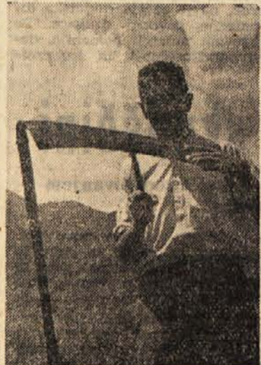
Poljedelski odbori so organizirali proizvodnjo in uporabo kvalitetnih semen, saj so lani domača semena krila 13% useh potreb po semenskem krompirju in 20% pri žitu. Medtem ko so zadrudniki leta 1952 uporabili na enem hektaru 36 kg umetnih gnojil, so jih lani že

Prihodnji teden bo v Ljubljani IV. redni zbor Glavne zadrudne zveze Slovenije, ki bo pregledal delo zadrudnih organizacij v zadnjih dveh letih ter začrtal bodoče naloge. Že letošnji občni zbori okrajnih zadrudnih zvez so pokazali, da so postale zadruge močan gospodarski in družbeni činitelj na vasi, saj so uspele pritegniti v sodelovanje množice kmetov, prispevale so k povečanju kmetijske proizvodnje in k splošnemu napredku vasi. Enotna splošna kmetijska zadruge, kot oblika samoupravljanja kmetijskih proizvajalcev, ki mobilizira njihove sile za napredek kmetijstva, se je v naših pogojih vsestransko zelo dobro obnesla, uveljavila pa se je tudi kot močan družbeni činitelj, ki doprinese k oblikovanju novih družbenih odnosov na vasi.