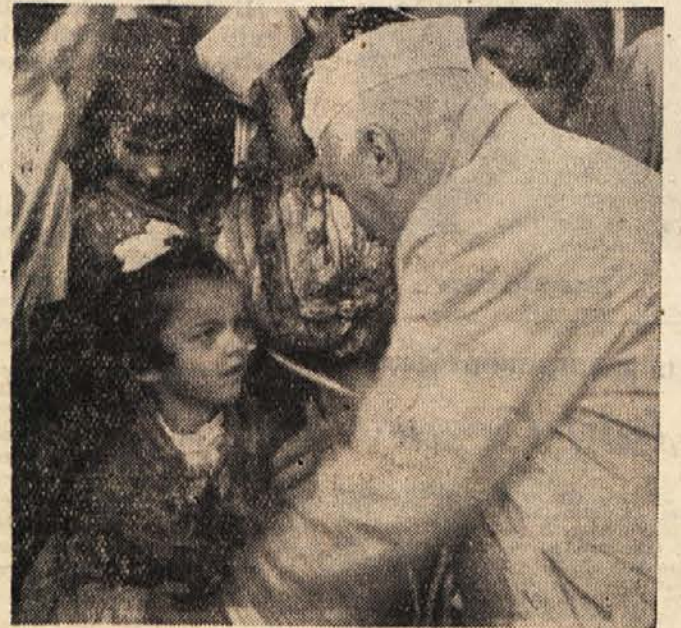
Ljubljanski pionirji so pozdravili predsednika Nehruja