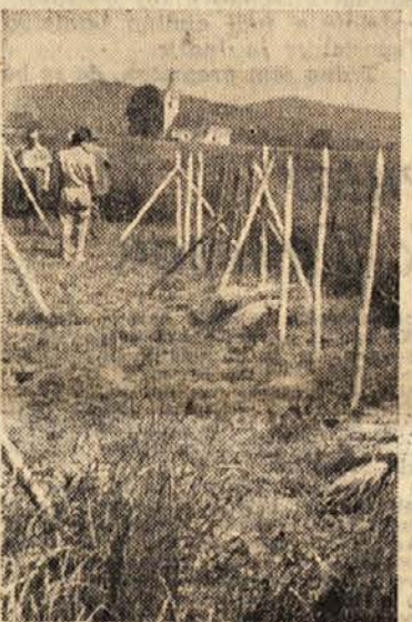
Tudi na poskusnem posestvu ljubljanske Fakultete za agronomijo letos sušijo na vrvenih kozolcih. Če se bo poskus obnesel, bodo betonski in leseni kozolci odveč