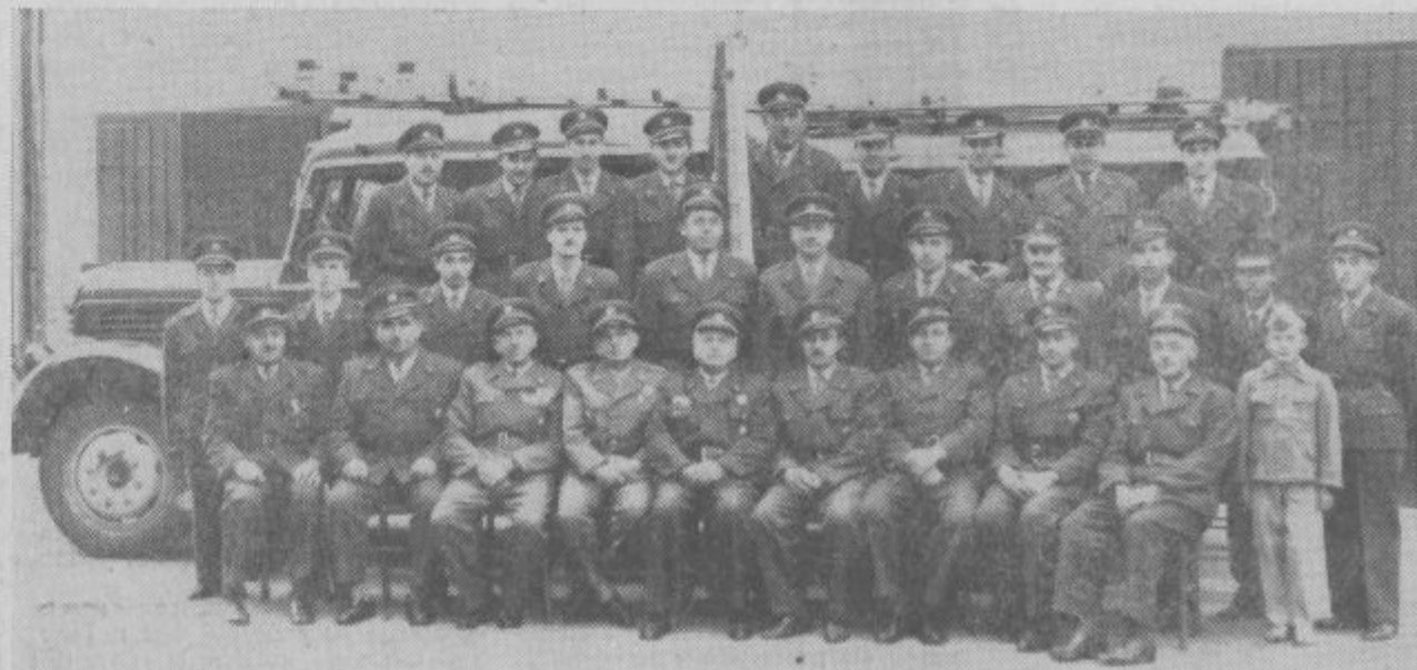
Predsednik SFRJ Josip Broz-Tito je Soštanjske gasilce odlikoval z ordenom.