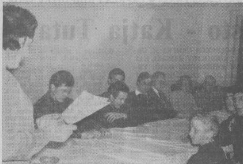
Odbojkarji iz Topolšice na občnem zboru.

Ob koncu so izvolili nov 19-članski upravni odbor.