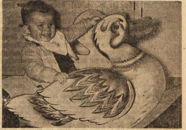
Mamica mi je kupila gugalcico