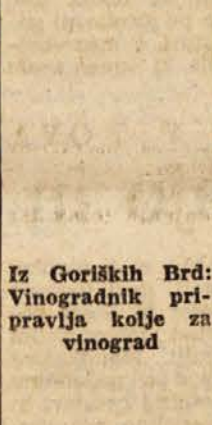
Iz Gorških Brd: Vinogradnik pripravlja kolje za vinograd

Tajništvo za prosveto in kulturo pri OLO v Novi Gorici proučuje načrt o zgraditvi novega poslopja za kmetijsko šolo v Ložah pri Vipavi. Grad v Ložah je namreč postal pretesen, ker je v njem poleg šestih stanovanj tudi upra-