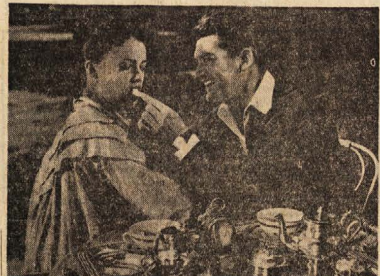
Po romanu francoske pisateljice Louise de Valmori je posnel pred leti znani filmski režiser Marc Allegret film: »Julietta«, v katerem se je dotaknil problema dozorevanja, pred katerim se znajde mlado dekle v sedanjem svetu. V glavni vlogi nastopa priljubljeni igralec Jean Marrais, njegove soigralke pa so kar tri mlade francoske zvezdnice: idealna naivka francoskega filma Deny Robin, Jeane Moreau in Nicole Berger. Na gornji sliki iz filma vidite Jeanna Marraisa in Jeane Moreau.

krat slovečemu amerškemu kiparju Gedricu Gibbonsu so naročili, naj napravi več osnutkov. Po dolgem prekanju so se odločili za osnutek kipa mišičastega moškega, naslonjenega na meč. Kipec naj bi bil pozlačen. In ta osnutek so tudi odobrili. Ko pa so pozlačen kipec razkazovali med filmskimi delavci, da bi zvedeli za njihovo mnenje, je neka statistika počila v smeh in vzkliznila: »No, kaj takšnega! Ta je pa na las podoben mojemu stricu Oscarju.« Filmski delavci so brž povzeli to ime kot vzdevek za nagrado. Prvotno ime nagrade je tako ali tako predolgo. In svet pozna zdaj ameriško filmsko nagrado samo še pod imenom »Oscar«.