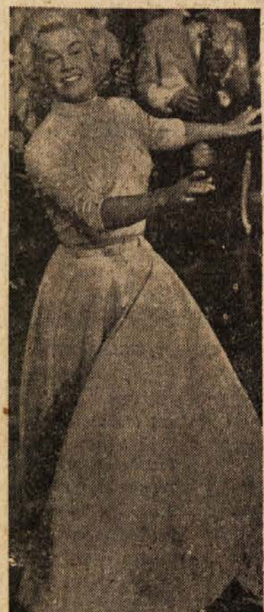
»Fant s trobento« je bil edini film, v katerem smo doslej pri nas videli priljubljeno ameriško pevko šlagerjev Doris Day. Letos pa jo bomo po dolgem času spet srečali v filmu »Ljubimca divjega zapada«.