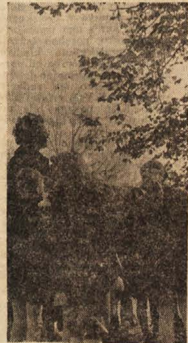
Obiskali smo grob padle partizanke

Ali hočete narediti veselje bratcu ali sestrici? Vzemite stare zamaške, stare vžigalice in jih tako obrežite, kakor vidite na risbi. Figura 3 kaže majhnega ptička, ki mu boste dodali še kljun, ki ga izrežete iz lepenke (figura 2), ga upognete in vtaknete v izrez njegove glavic. Za rep pa si oskrbite kurja peresca in ptiček bo gotov. Na spodnji sliki pa vidite jelena. Če ga naredite prav tako iz starih zamaškov in vžigalic, le na glavo mu nataknete roge iz poljubnega materiala.