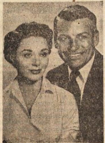
Za Grace Kelly bo treba najti nadomestilo. O tem so si v ameriški filmski metropoli že na jasnem, kajti Grace bo po svoji poroki nastopila samo še v dveh filmih družbe Paramount, ker jo na to veže pogodba. Kdo jo bo nadomestil? To vprašanje ne zanima samo številne ljubitelje filma, temveč verjetno še veliko bolj same producente. Za sedaj omenjajo dvoje imen: Američanko Vero Miles, predvsem pa Angležinjo Dano Wynter. Le-ta združuje po mnenju filmskih novinarjev v sebi »milino in lepoto Ave Gardner, igralski talent Audrey Hepburn, in lastnosti prave dame, kot jih ima samo Grace Kelly.« Je hčerka londonskega zdravnika in je morala oditi prav v Hollywood, da se ji je izpolnila njena največja želja — postati filmska igralka. Na sliki jo vidite skupaj s svojim soigralcem iz filma »Zvezda iz Pompejev« Richardom Eganom.

bilo leto 1955, ki ga mnogi smatrajo za prelomnico v švicarski sedmi umetnosti, se sedaj še ne da reči. To bo pokazala šele prihodnost. Skoraj z gotovostjo se lahko trdimo, da je na obzorju spet nova kinematografija, ki utegne v naslednjih letih prispevati precejšen delež k nadaljnemu razvoju filmske umetnosti in da se bo Švica lepo uveljavila kot filmska dežela.