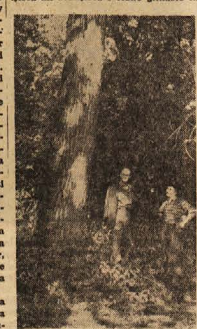
Ta topol je star 27 let in je debel 80 cm. Raste ob Dravi pri Veliki Nedelji

Topol najbolj uspeva ob tekoči vodi na globoki in na sveži zemlji, medtem ko stalna močvirnata zemljišča ali zemljišča s težko glinasto in