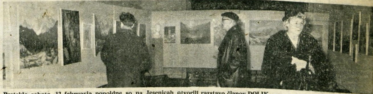
Preteklo soboto, 12. februarja popoldne so na Jesenicah otvorili razstavo članov DOLIK