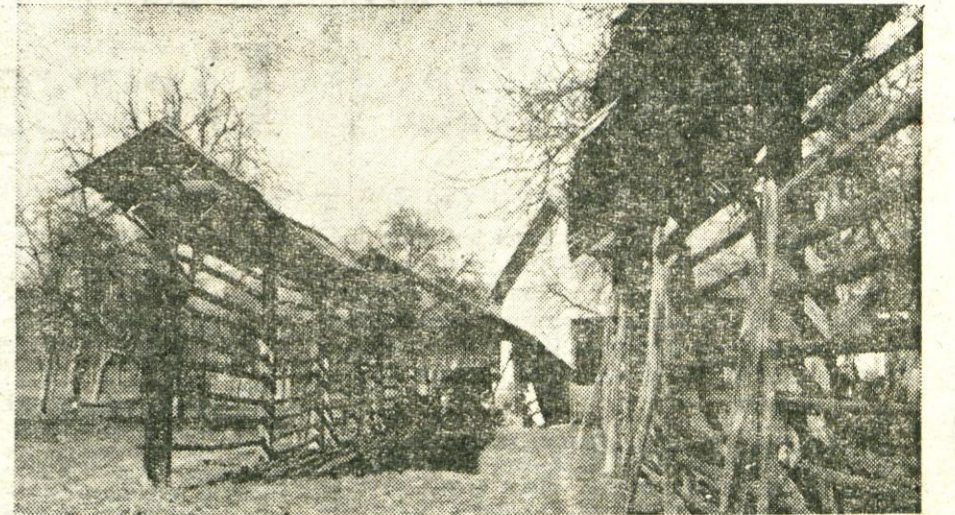
Kozolec je gospodarska zgradba kmečkega doma, ki je slovenska nacionalna posebnost. V naši rubriki o kozolcih še nismo pisali, zato zdaj vabimo bralece, da nam o njih kaj več napišejo: kako kozolec in posamezne njegove dele imenujejo v posameznih krajih na Gorenjskem, kakšna je konstrukcija kozolca, velikost, odvisnost velikosti kozolca od velikosti kmetije, kako skladajo v kozolec, kaj v njem sušijo in za kaj ga še uporabljajo, ali ima kmetija enega ali več kozolcev, kje stojijo, kako so postavljeni z ozirom na smer vetra, sončno lego in obliko parcele, kako in kdo gradi kozolce itd. Pišite nam tudi še o vseh drugih gospodarskih stavbah kmetije, o delu in običajih v zvezi z delom, o drugih običajih, ki so v zvezi s človekovim rojstvom, smrtjo ali po-roko ali z letnimi časi itd. Zdjaj, ko je pred vrati pustni čas, nam pišite o pustnih običajih danes in včasih v vašem kraju; in ker smo že skoraj pred vrati pomladi, bo zanimivo slišati tudi kaj o običajih v zvezi s prehodom zime v pomlad. Vse vaše dopise bomo objavili. — Na sliki: Azmanov kozolec na Okroglem