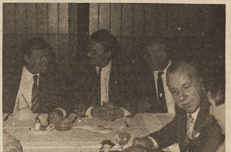
Od zunanjih poslovnih partnerjev sta letošnje priznanje prejela tudi Orahovica in Kraš.