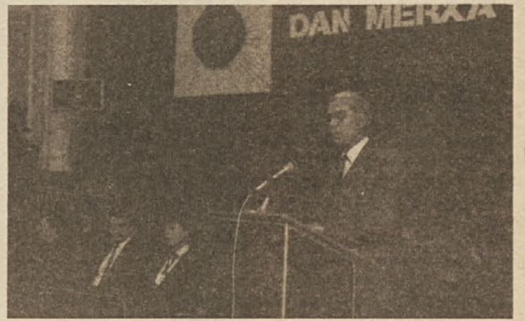
Odločno moramo zavračati vse poskuse uravnilovke pri vrednotenju rezultatov dela, ki jih ljudje dosegajo. Čas, v katerem živimo, zahteva prodorne in zagnane ljudi, zato pa jih moramo stimulirati.

zahtevali jasne odgovore in ustrezne akcije. To pa pomeni, da to, kar imamo in kar smo dosegli, ni nikakršna trajno pridobljena pravica, kot si to posamezniki v mnogih okoljih predstavljajo. Mi moramo nadaljevati začrtano pot, upoštevajoč pri tem našo specifičnost in vlogo, ki jo imamo kot agroživilski oziroma preskrbovalni, široko razvejani poslovni sistem v Sloveniji in širše. Na tej poti bomo zmogli premagovati še tako zapletene ovire.