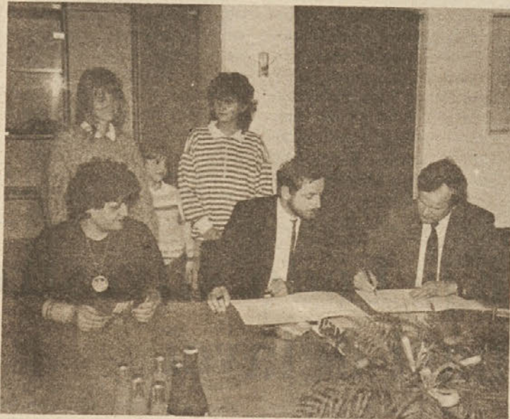
Na posnetku so tudi najuspešnejše drsalke drsalno-kotalkarskega kluba.

Kot pokrovitelj drsalnega kotalkarskega kluba Celje, ki se bo odslej imenoval po delovni organizaciji Tkanina, bo le ta pridobila pravico do brezplačnih vstopnic za rekreativno drsanje za vse tiste delavce, ki se zani- majo za tovrstno rekreacijo.