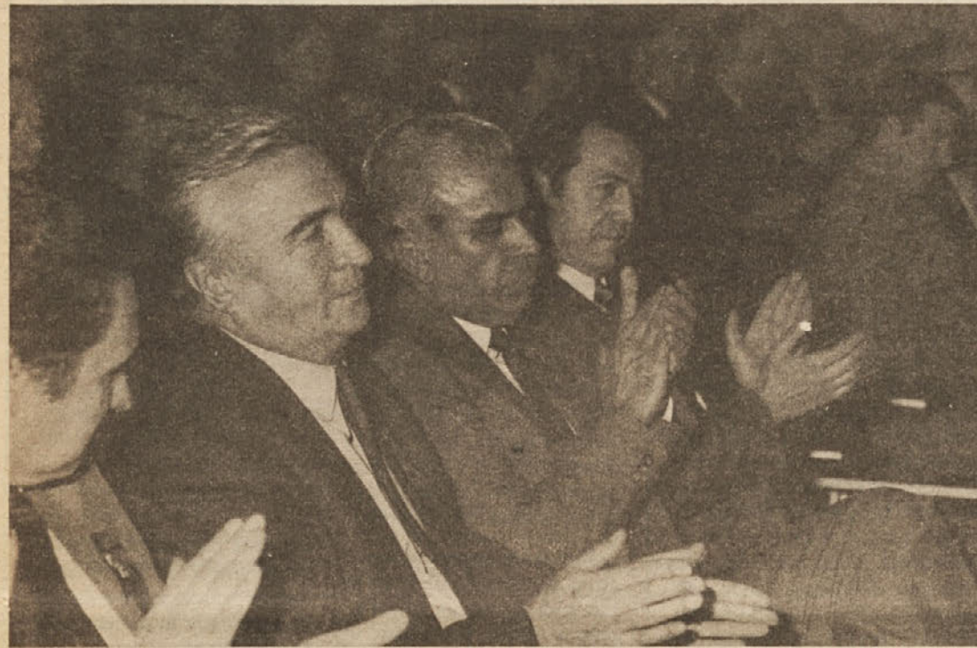
Slavnostne seje delavskega sveta sozda ob dnevu Merxa so se udeležili tudi najodgovornejši delavci gospodarstva in politiki občine Celje.

Čaka nas nekaj velikih investicijskih podvigov, kot so zdraviliški kompleks Dobrna, Prodajni center Rogaska Slatina, kmetijsko-živilske in predelovalne kapacitete, razvoj avtomobilске stroke, realizacija ambiciozno zastavljenih programov na področju obrtne kooperacije in drugi. Nismo zaostali in smelo načrtujemo posamezne programe. Sedanji rod mora ustvarjati možnosti za nova delovna mesta in s tem perspektivo mladim. Sicer pa je v Merxu