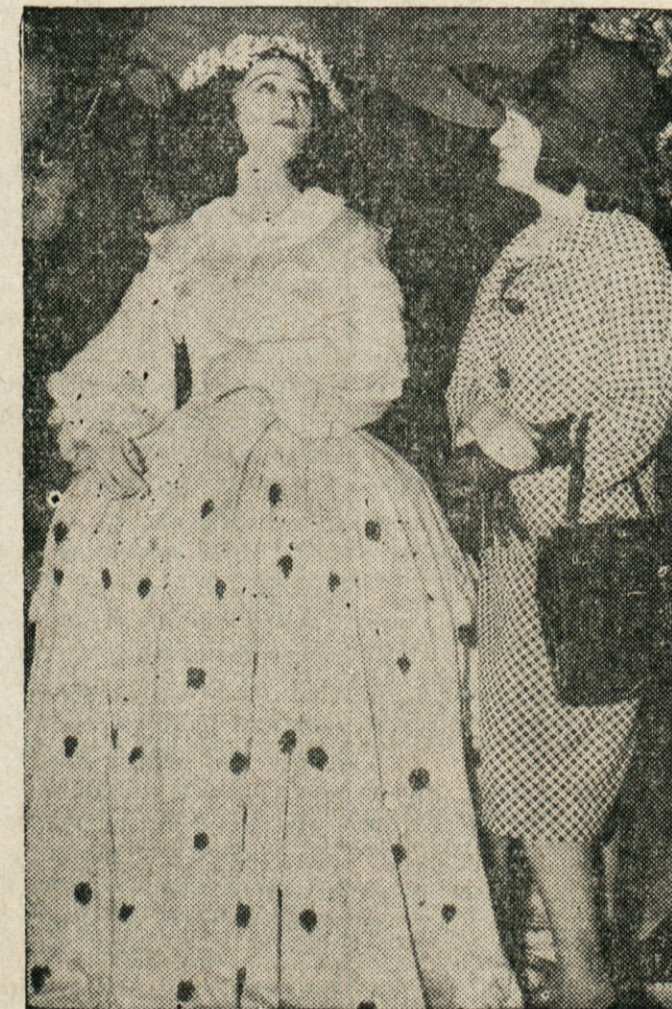
VMES JE VRSTA LET — Pola Negri ogleduje svojo podobo v vosku iz dni, ko je bila slavna filmska igralka. Sedaj živi v San Antoniu, Tex.