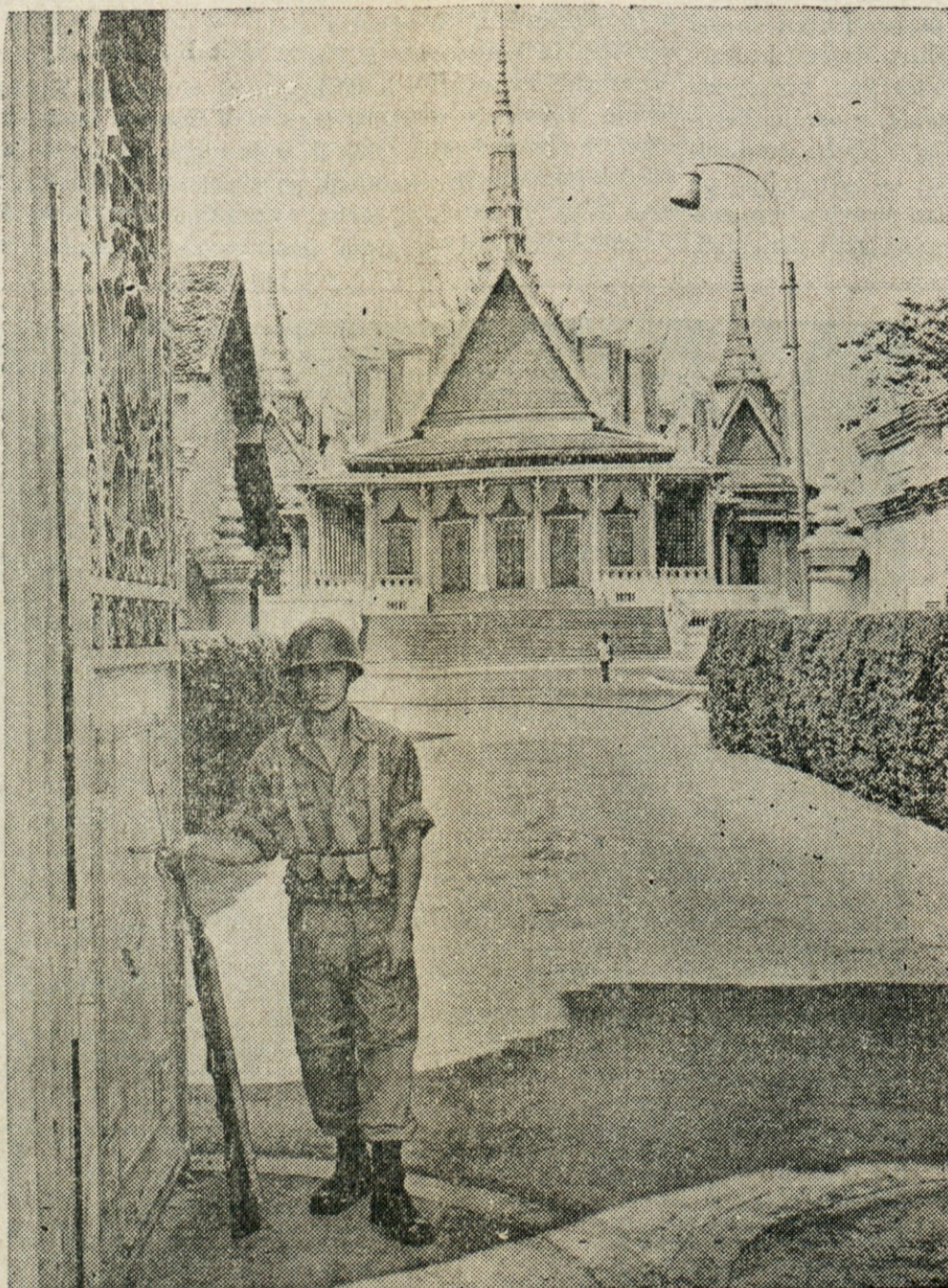
VOJAŠKE STRAZE — Phnom Penh, glavno mesto, je sicer mirno, pa vendar v skrbeh zaradi nevarnosti rdečih gverilcev, ki rinejo od juga in vzhoda proti mestu. V mestu so vsepovsod razpostavljene vojaške straze.